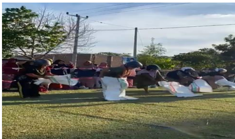
Gambar 4. Kegiatan Lomba Balap Karung