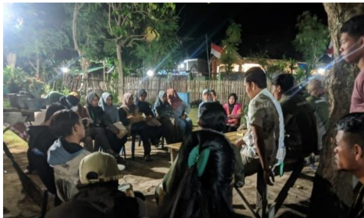
Gambar 2. Sosialisasi dan diskusi bersama anggota kelompok dan ketua karang taruna terkait Pembentukan Panitia kegiatan 17-an

Konsep perlombaan yang akan dilakukan adalah kegiatan lomba tersebut dilaksanakan 4 hari selesai, setelah itu lomba-lomba dengan 3 kategori peserta untuk 4 jenis perlombaan. 3 kategori peserta itu adalah untuk ibu-ibu, bapak-bapak, dan anak-anak. Sedangkan 4 jenis lomba yang akan dilakukan adalah lomba makan kerupuk, lomba balap kelereng, balap karung dan lomba tarik tambang. Disamping itu, dalam diskusi bersama tersebut telah disepakati bahwa kepanitiaan memilih sekretaris berjumlah 2 orang, bendahara berjumlah 2 orang, penanggung jawab makan kerupuk 5 orang, dan penanggung jawab setiap jenis lomba berjumlah 5 orang. Kegiatan tersebut akan dilaksanakan pada tanggal 16 Agustus 2023 di lapangan mulai pukul 15.00 WIB sampai selesai. Berikut adalah dokumentasi kegiatan sosialisasi dan diskusi bersama dengan karang taruna: