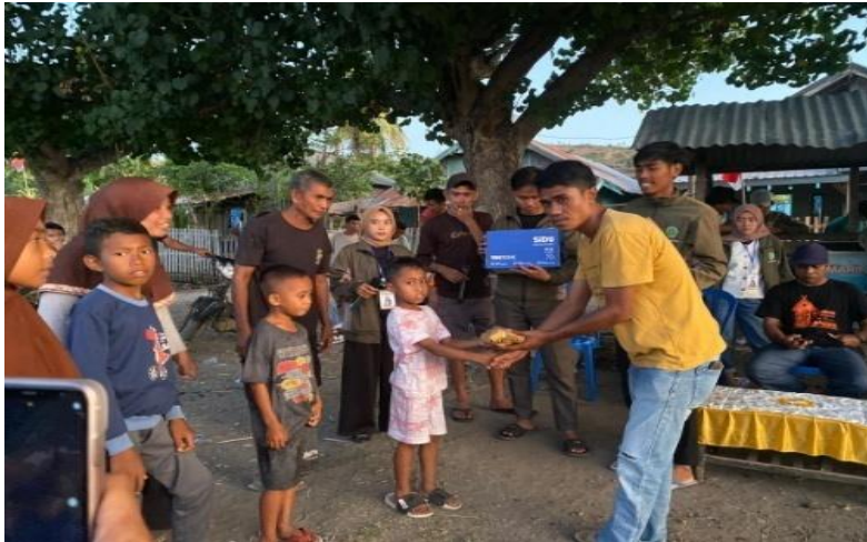
Gambar 7. Kegiatan Pembagian Hadiah Berbagai Mata Lomba