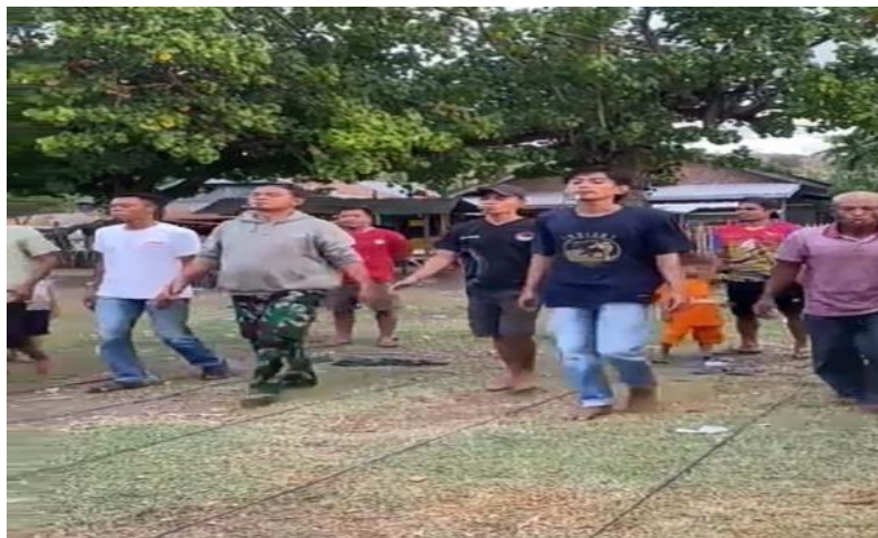
Gambar 6. Kegiatan Balap Kelereng