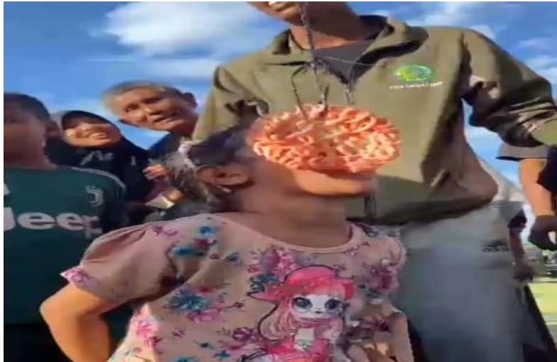
Gambar 5. Kegiatan Lomba Makan Kerupuk