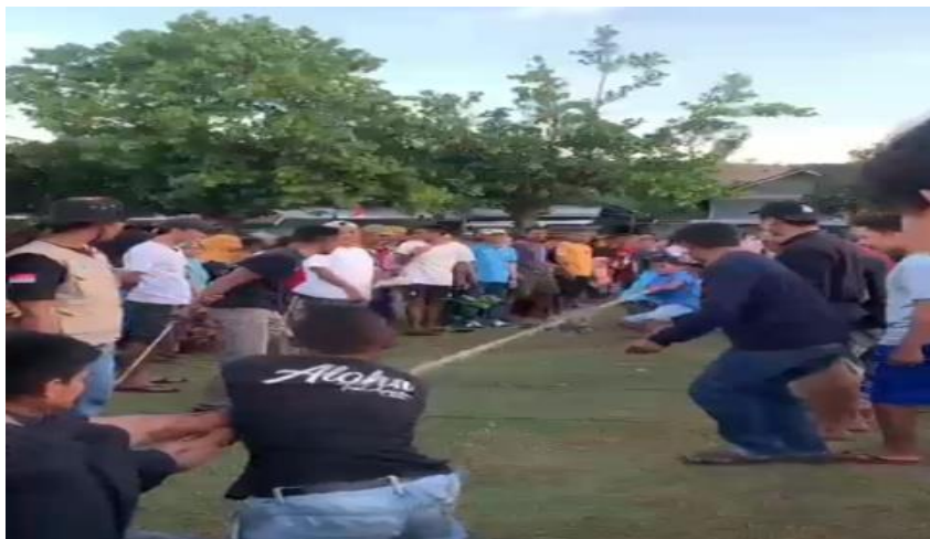
Gambar 3. Kegiatan Lomba Tarik Tambang

Pelaksanaan lomba dimulai dari pertama, lomba makan kerupuk, lomba balap kelereng, lomba balap karung dan lomba tarik tambang untuk kategori ibu-ibu. Kedua, lomba balap kelereng, lomba balap karung dan lomba tarik tambang untuk kategori bapak-bapak. Dan yang terakhir lomba makan kerupuk, lomba balap karung, lomba balap kelereng, dan lomba tarik tambang untuk kategori anak-anak. Disela-sela perlombaan tersebut juga terdapat pengundian doorprize untuk masyarakat desa yang sudah ikut berpartisipasi. Perlombaan tersebut diambil 3 pemenang dari masing-masing kategori, dan kegiatan tersebut berjalan dengan lancar dan sesuai rencana.