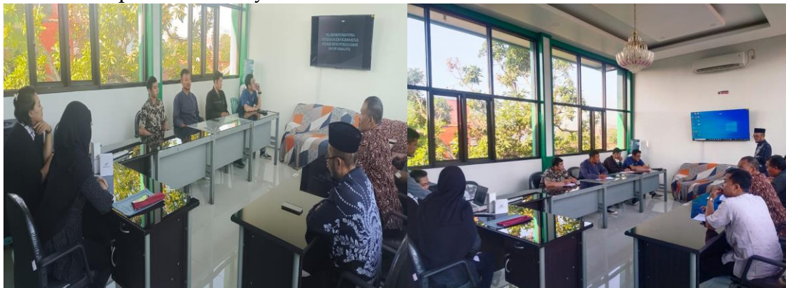
Gambar 2. Kegiatan Pengabdian