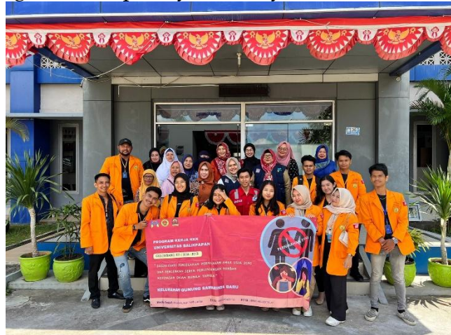
Gambar 5. Foto bersama DP3AKB dan ibu – ibu PKK Keterangan: Dokumentasi penutupan kegiatan sosialisasi

kerahasiaan identitas pelapor dan non-diskriminasi dalam pelayanan menjadi faktor penting yang meningkatkan kepercayaan masyarakat untuk mengakses layanan.