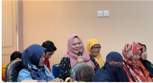
Gambar 3. Sesi Tanya Jawab

Keterangan: Peserta aktif mengajukan pertanyaan terkait penanganan kasus KDRT