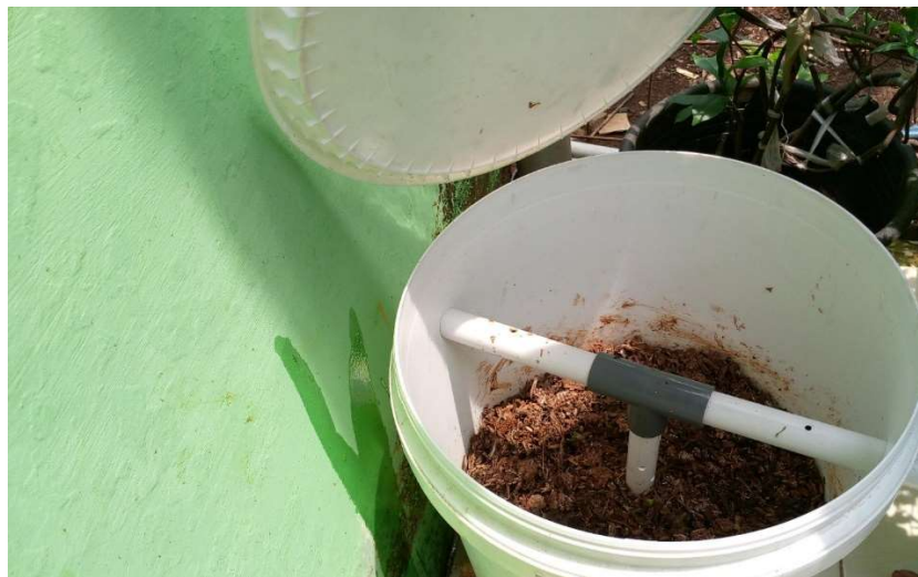
Gambar 4. Produksi Kompos Sampah Organik Rumah Tangga