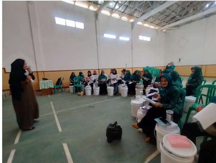
Gambar 3. Praktik Pengelolaan Sampah Organik Rumah Tangga