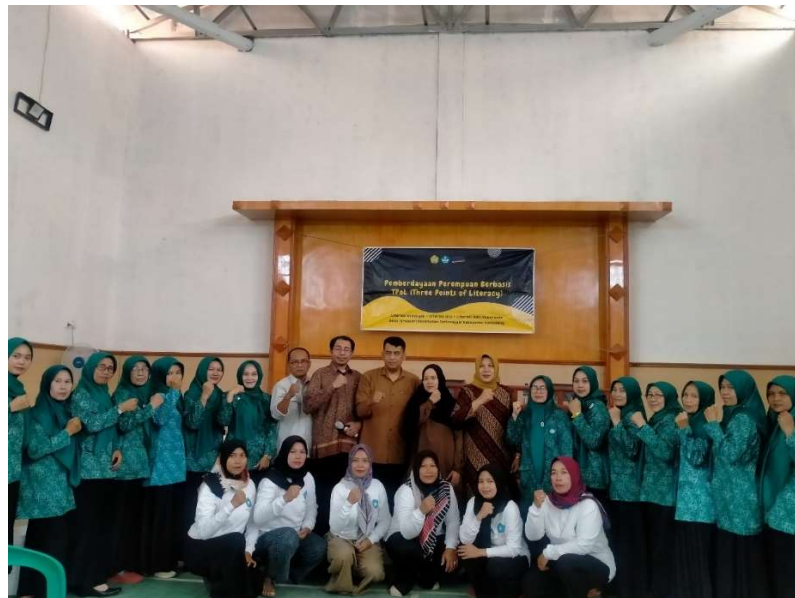
Gambar 2. Pelatihan Pengelolaan Sampah Organik Rumah Tangga