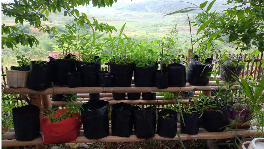
Gambar 5. Penggunaan Kompos Pada Tanaman

Peningkatan pengetahuan, perubahan praktik, dan dampak positif terhadap lingkungan merupakan hasil yang signifikan dari pengabdian ini. Metode partisipatif yang melibatkan komunitas secara aktif terbukti efektif dalam mencapai tujuan pengabdian. Dengan adanya dukungan berkelanjutan dari pemerintah lokal dan kelompok masyarakat, implementasi praktik pengelolaan sampah organik di tingkat rumah tangga dapat berlanjut dan berkontribusi pada pembangunan berkelanjutan di Desa Sirnasari.