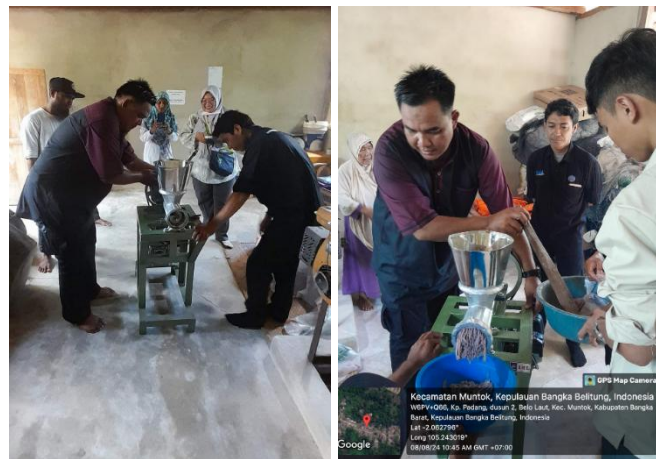
Gambar 4. Uji coba mesin penggiling Udang Rebon

Mesin berhasil diujicoba dengan baik (Gambar 4). Udang Rebon yang disiapkan kelompok dapat tergiling sempurna. Kondisi ini memungkinkan pengurangan proses produksi dengan ditiadakannya tahapan penghancuran ulang setelah fermentasi. Penggilingan dengan mesin juga memungkinkan produk lebih seragam tekstur dan kualitasnya. Penggilingan secara mekanis menghasilkan bahan baku terasi dengan ukuran yang relatif seragam. Keseragaman ini akan menciptakan homogenitas campuran, sehingga produk yang dihasilkan memiliki cita rasa yang konsisten (Firdaus et al. , 2021).