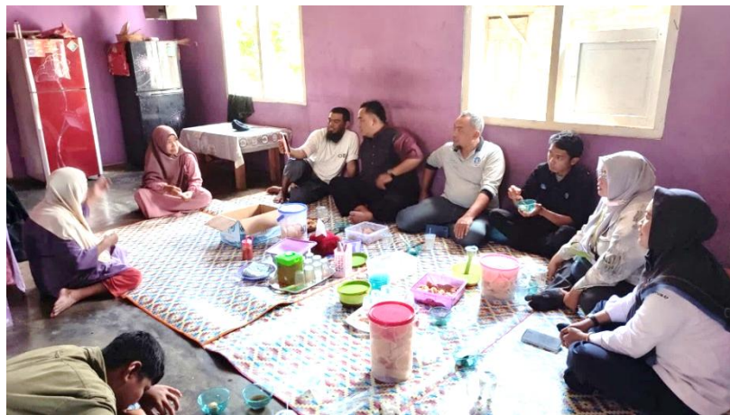
Gambar 3. Diskusi pengembangan usaha produksi terasi bersama poklhasar Terasi Jakfar dan penyuluh perikanan

Pelaksanaan kegiatan pengabdian di Poklhasar Terasi Jakfar diawali dengan FGD untuk mendiskusikan terkait potensi yang dimiliki oleh mitra (Gambar 3). Diskusi dilakukan secara non formal untuk memudahkan diskusi dan mitra tidak canggung untuk menyampaikan pendapat. Hal ini bertujuan untuk menjadikan diskusi dengan poklhasar lebih cair dan menyesuaikan gaya bahasa mereka. Formalitas sebagaimana rapat seringkali menjadi penghambat komunikasi dalam penyuluhan (Sutrisno, 2016). Penggunaan bahasa lokal dalam penyuluhan juga berperan dalam kemudahan pemahaman hal-hal yang disampaikan (Audya, 2023). Ramadhana dan Subekti (2021) juga menemukan kondisi bahwa kontak penyuluhan informal memudahkan komunikasi dan menghilangkan sekat kecanggungan. Dalam diskusi tersebut, poklhasar juga didampingi oleh penyuluh perikanan wilayah Kecamatan Mentok.