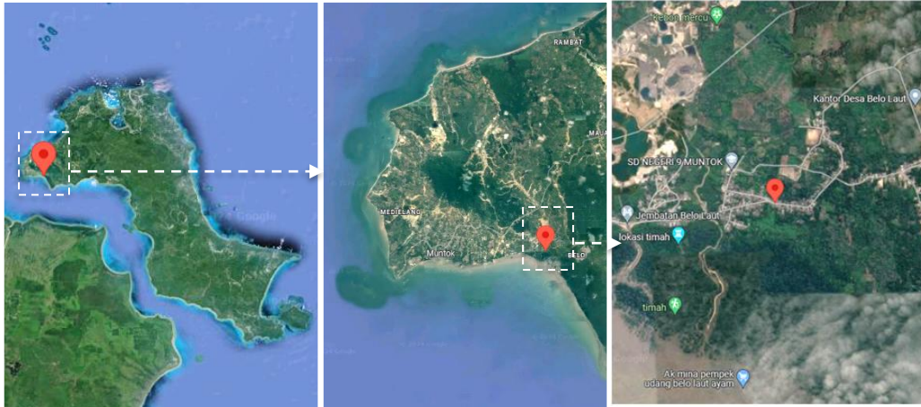
Gambar 1. Lokasi Poklhasar Terasi Jakfar di Desa Belo Laut, Bangka Barat

Metode yang diterapkan dalam pengabdian kepada masyarakat ini adalah Asset Based Community Development (ABCD). Affandi (2022) menjelaskan bahwa metode ABCD adalah melakukan pengabdian berbasis kekuatan dan potensi masyarakat. Pendekatan ABCD memungkinkan masyarakat membangun desanya dengan kekuatan yang sudah ada di tengah masyarakat. Metode ABCD dapat meningkatkan partisipasi masyarakat, membangun kapasitas lokal, dan menciptakan program yang lebih berkelanjutan (Khasanah et al. , 2024).