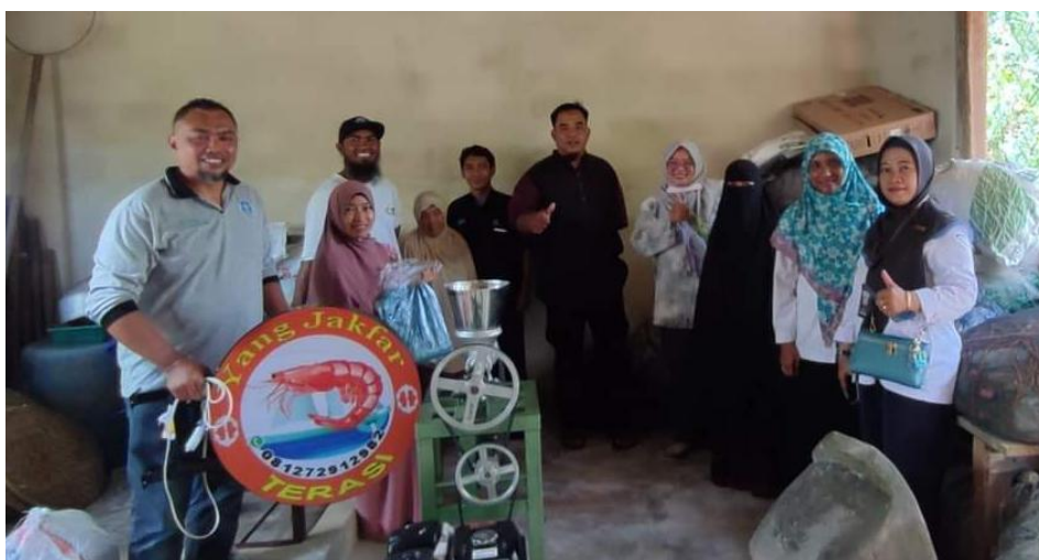
Gambar 5. Penyerahan bantuan mesin giling untuk produksi terasi