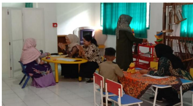
Gambar 3. Pelaksanaan Asesmen

Sebagai bagian dari kegiatan implementatif, asesmen lapangan dilakukan terhadap empat peserta didik dari Sekolah Cordova Fun Islamic Learning. Proses asesmen dilaksanakan oleh tim asesor, dengan hasil asesmen disampaikan secara langsung kepada orang tua masing-masing peserta didik. Informasi yang diperoleh kemudian dianalisis lebih lanjut untuk merumuskan rekomendasi intervensi dan strategi pembelajaran yang sesuai dengan kebutuhan unik tiap peserta didik.