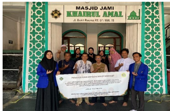
Gambar 5. Sesi penutupan

Sedangkan gambaran singkat fasilitas SIKEMAS sebagai berikut :