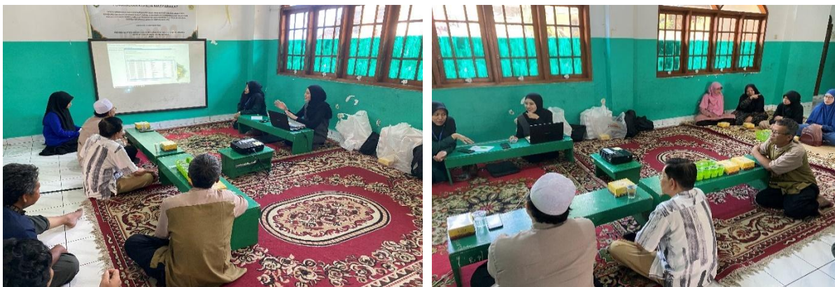
Gambar 3. Sesi diskusi

Banyak hal yang didiskusikan atau permasalahan yang disampaikan peserta ke narasumber terkait penggunaan SIKEMAS. Dokumentasi sesi diskusi dan tanya jawab terdapat pada gambar 3.