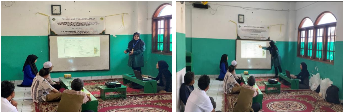
Gambar 2. Pemaparan materi penggunaan SIKEMAS

bukti pembayaran yang bebas dari kesalahan dan dapat dicetak kapan saja. Dokumentasi pemaparan materi terdapat pada gambar 2.