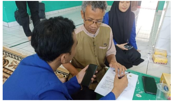
Gambar 4. Sesi evaluasi

Setelah pengisian kuesioner, dilanjutkan dengan sesi penutup dengan penyerahan perangkat instalasi SIKEMAS secara simbolis ke DKM Khairul Amal. Dokumentasi penyerahan aplikasi SIKEMAS secara simbolis terdapat pada gambar 5.