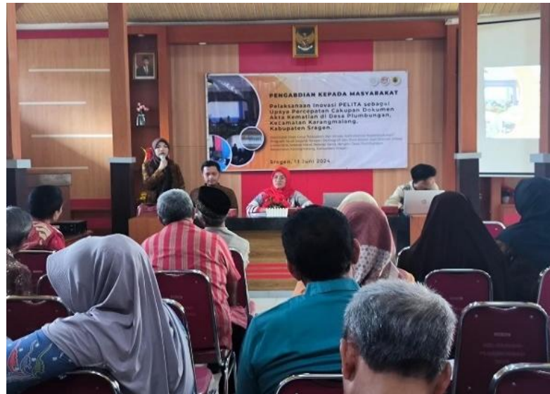
Gambar 2. Pelaksanaan Pengabdian Masyarakat di Desa Plumbungan

memberikan penjelasan yang relevan mengenai kebijakan dan regulasi yang berlaku. Metode interaktif seperti tanya jawab dan simulasi pengurusan dokumen juga diterapkan agar peserta lebih terlibat dan memahami prosesnya dengan baik. Dengan memberikan panduan yang jelas tentang prosedur pengurusan dokumen kependudukan, sosialisasi ini bertujuan membantu masyarakat agar lebih mudah memahami alur inovasi PELITA.