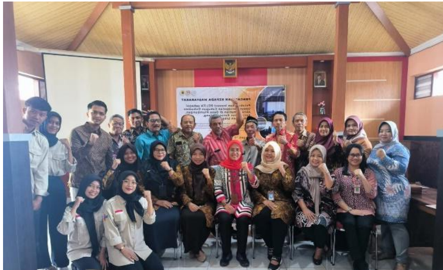
Gambar 3. Peserta Pengabdian Masyarakat di Desa Plumbungan