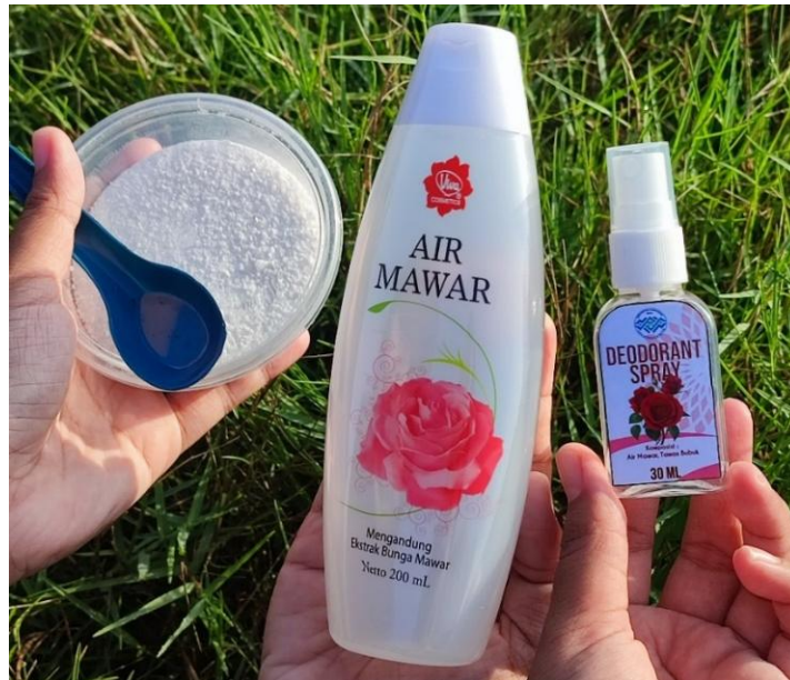
Gambar 5. Alat dan Bahan untuk membuat deodorant spray dari batu tawas

Setelah mendapatkan izin dari pihak sekolah SMPN 5 Sampit, Tim KKN IAIN Palangka Raya melakukan pelatihan pada Selasa, 13 Agustus 2024. Adapun alat dan bahan yang digunakan untuk membuat deodorant spray dari batu tawas sebagai berikut : Batu tawas yang dihaluskan (1/2 sdm), Air mawar (30 ml), botol spray ukuran 30 ml, sendok makan.