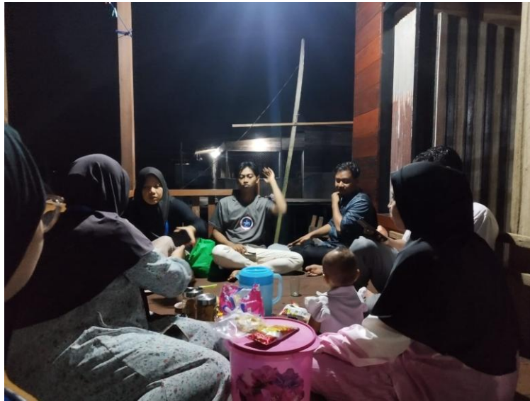
Gambar 2. Tim KKN IAIN Palangka Raya mencari potensi-potensi yang ada di desa Terantang melalui diskusi bersama sekretaris dan masyarakat desa

Setelah melakukan wawancara dan observasi dengan sekretaris dan masyarakat Desa Terantang pada Sabtu, 27 Juli 2024. Adapun hasil yang diketahui yakni aset-aset sumber daya alam (SDA) berupa rotan, kelapa sawit, kayu, ikan sungai dan batu tawas. Dari beberapa aset sumber daya alam yang ada di Desa Terantang, Tim KKN IAIN Palangka Raya berfokus pada aset batu tawas karena banyak diperjual belikan dengan harga terjangkau. Sejauh ini warga Desa Terantang hanya menggunakan batu tawas sebagai penjernih air. Sehingga, tim KKN IAIN Palangka Raya memiliki ide untuk meningkatkan keterampilan bisnis melalui pembuatan deodorant spray yang belum ada terfikirkan oleh masyarakat setempat.