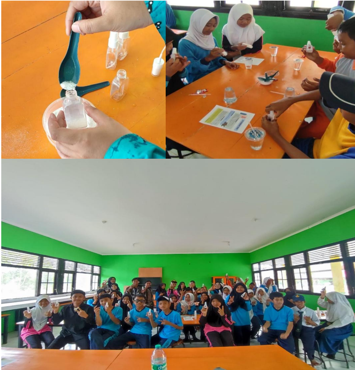
Gambar 7. Proses pembuatan deodorant spray di SMPN 5 Sampit

Setelah tim KKN IAIN Palangka Raya melakukan pelatihan siswa/i dan para guru memberikan tanggapan positif untuk melakukan praktik tersebut lebih lanjut. Oleh karena itu, dengan adanya pelatihan ini para siswa/i SMPN 5 Sampit termasuk Generasi Z antusias untuk mengembangkan dan menjadikan produk deodorant spray menjadi ide bisnis. Sejalan dengan perkembangan teknologi internet saat ini yang dijadikan sebagai alat menyebarkan informasi yang cepat bahkan mendominasi jika dibandingkan dengan media lainnya sehingga dapat menguntungkan bagi Generasi Z yang dekat dengan teknologi (Hutamy dkk., 2021).