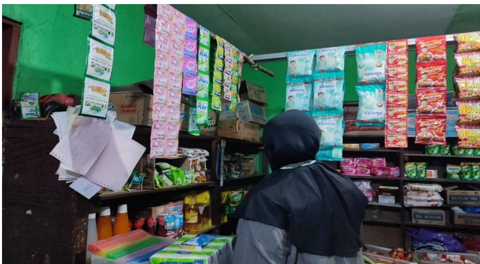
Gambar 3. Tim KKN melakukan observasi ke warung untuk mendapatkan informasi perihal batu tawas

Setelah melakukan wawancara dan observasi dengan sekretaris dan masyarakat Desa Terantang pada Sabtu, 27 Juli 2024. Adapun hasil yang diketahui yakni aset-aset sumber daya alam (SDA) berupa rotan, kelapa sawit, kayu, ikan sungai dan batu tawas. Dari beberapa aset sumber daya alam yang ada di Desa Terantang, Tim KKN IAIN Palangka Raya berfokus pada aset batu tawas karena banyak diperjual belikan dengan harga terjangkau. Sejauh ini warga Desa Terantang hanya menggunakan batu tawas sebagai penjernih air. Sehingga, tim KKN IAIN Palangka Raya memiliki ide untuk meningkatkan keterampilan bisnis melalui pembuatan deodorant spray yang belum ada terfikirkan oleh masyarakat setempat.