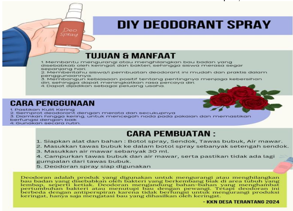
Gambar 6. Berikut langkah-langkah proses pembuatan deodorant spray di SMPN 5 Sampit