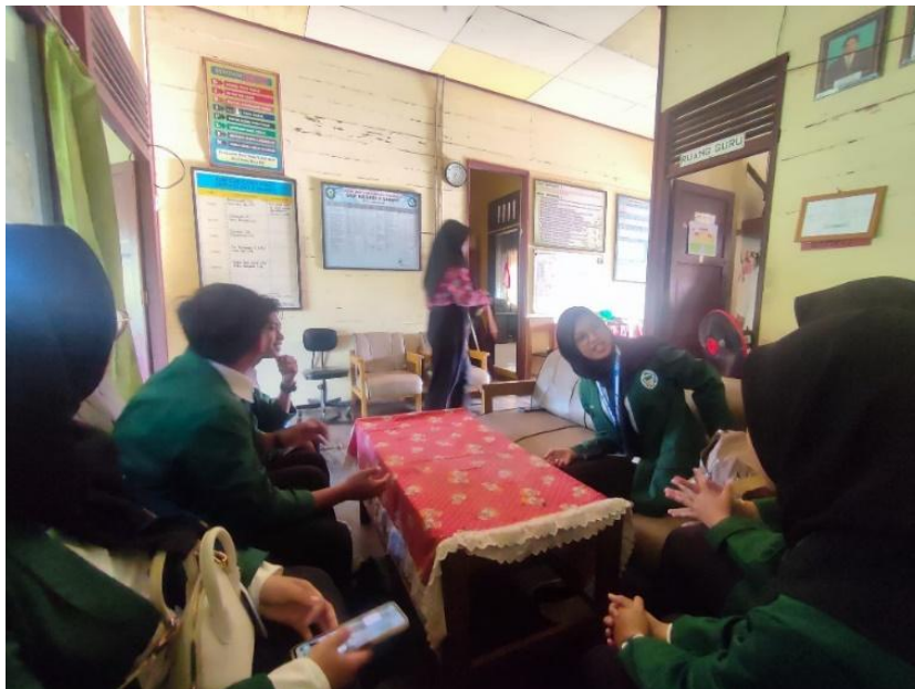
Gambar 4. Tim KKN IAIN Palangka Raya mengunjungi SMPN 5 Sampit untuk meminta izin melakukan pelatihan deodorant spray

Sebelum melakukan pelatihan, tim KKN IAIN Palangka Raya mencoba membuat deodorant spray dan digunakan secara mandiri. Setelah melalui tahap percobaan dan dirasa tidak menimbulkan efek samping seperti gatal-gatal atau kemerahan setelah digunakan. Tim KKN IAIN Palangka Raya mengunjungi SMPN 5 Sampit untuk meminta izin melakukan pelatihan pembuatan deodorant spray untuk siswa/i.