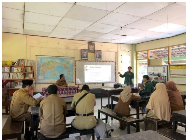
Gambar 2. Presentasi Proker

Hasil observasi dengan wawancara guru dan masuk ke kelas, kami menemukan siswa siswa yang kurang lancar baca tulis dan berhitung yaitu terdapat 5 siswa di kelas 3, 1 siswa di kelas 4, dan 3 siswa di kelas 5.