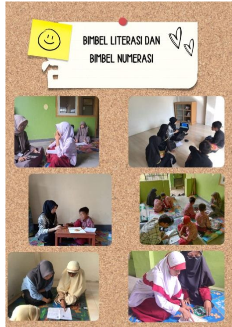
Gambar 4. Pelaksanaan kegiatan Bimbel

Selain dari program Bimbingan Belajar (Bimbel Literasi dan Numerasi) kami mengambil alih jam P5 di sabtu budaya. Dikarenakan SDN 2 Masbagik Timur baru menerapkan Kurikulum Merdeka, waktu pelaksanaan P5 sabtu budaya masih menjadi jam kosong, yang dimanfaatkan untuk gotong royong pembersihan sekolah, menghias kelas, dan sebagian siswa memainkan permainan tradisional. kami memanfaatkan jam tersebut untuk menyelingi kegiatan diatas, memasukkan pembelajaran dengan video edukasi dan ceramah singkat untuk membuka wawasan mendukung literasi siswa khususnya kelas 3,4,5 dan 6 dengan tema berbeda di setiap minggunya seperti penguatan profil pancasila , dokter cilik, mempelajari tarian sasak dll.