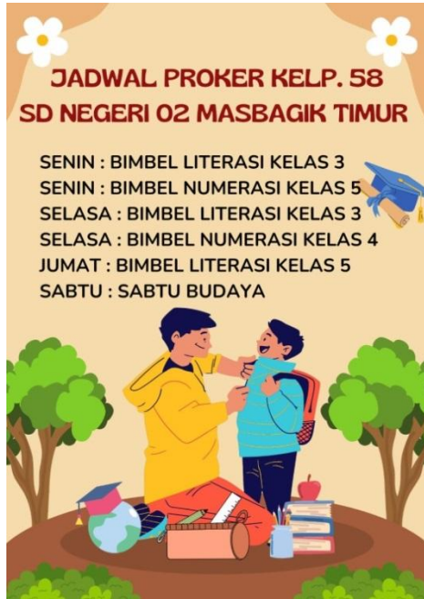
Gambar 3. Jadwal kegiatan

mengganggu jalannya pembelajaran di dalam kelas. Metode privat bertujuan untuk menangani anak dengan kepribadian unik dengan pendekatan personal untuk menemukan metode yang pas untuk anak (Fransiska, 2022).