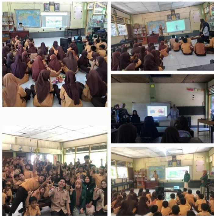
Gambar 5. P5 Sabtu Budaya