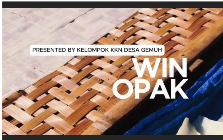
Gambar 5. Hasil video branding UMKM