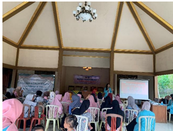
Gambar 2. Pengenalan e-commerce

Program kerja ini diselenggarakan pada Kamis (11/7/2024). Kegiatan ini melibatkan ibu-ibu PKK dan warga yang mempunyai usaha di Desa Gemuh. Tujuannya yaitu untuk meningkatkan keterampilan masyarakat dalam menggunakan e-commerce untuk menjual produk. E-commerce dapat menjadi salah satu batu loncatan untuk mengembangkan UMKM di Desa Gemuh dengan kemudahan akses pemasaran dan luasnya jangkauan konsumen.