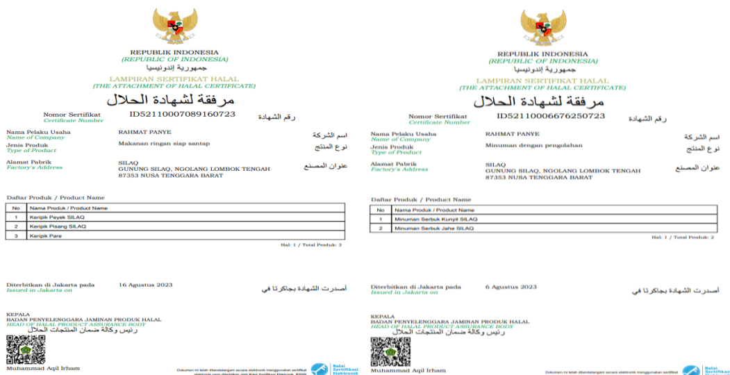
Gambar 4. Sertifikat halal produk olahan makanan ringan dan serbuk minuman herbal

Pengajuan sertifikasi halal ini tersistem dengan OSS sehingga Ketika sudah memiliki NIB maka secara terintegrasi data pengelola usaha yang mengajukan sertifikasi halal telah tercantum pada web pengajuan sertifikasi halal. Dalam pengajuan sertifikasi halal ini tim pengabdian dan Masyarakat didampingi oleh perwakilan dari Dinas Perindustrian. Pengajuan sertifikasi halal melalui web ini dilakukan langkah-langkah mulai dari pengajuan sertifikat dan memilih KBLI (Klasifikasi Baku Lapangan Usaha Indonesia). Olahan pangan yang diajukan sertifikat halalnya antara lain adalah peyek, keripik pare, keripik pisang, serbuk minuman jahe, dan serbuk minuman kunyit. Dalam pengajuan halal ini dibagi ke dalam 2 KBLI, KBLI 1 10762 yaitu Industri Kerupuk, Keripik, Peyek Dan Sejenisnya, dan KBLI 10794 yang lain adalah industri pengolahan herbal (jahe dan kunyit). Gambar 3 dibawah merupakan gambar sertifikat halal untuk produk olahan pangan yang diproduksi oleh Kelompok Wanita Tani Desa Kuta.