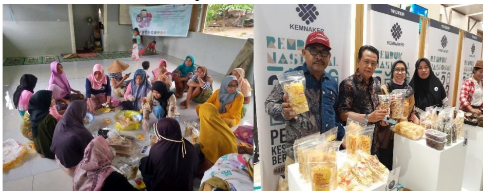
Gambar 2. Praktik Pengemasan Produk Olahan dan Pameran Olahan Produk di Surabaya

Kegiatan pendampingan legalisasi ini merupakan bagian dari kelanjutan kegiatan pengabdian pengolahan pangan berbasis tanaman lokal. Pada pengabdian sebelumnya kelompok wanita tani didampingi dan dilatih membuat keripik pare, keripik pisang, jahe, dan kunyit bubuk. Olahan-olahan tersebut yang merupakan olahan pangan yang didorong sebagai olahan pangan yang memiliki izin edar diberbagai tempat. Kegiatan pengabdian yang selanjutnya ini diawali dengan packaging olahan pangan yang akan menjadi produk yang dipasarkan oleh KWT Rasa Saling Sayang. Olahan pangan yang diproduksi KWT dan yang didaftarkan sebagai olahan pangan yang memiliki legalitas tersebut antara lain pengolahan keripik pisang, keripik pare, peyek, minuman serbuk kunyit dan minuman serbuk jahe. Kegiatan packaging olahan pangan ini termasuk dalam pemilihan kantong kemasan, label pada kemasan yang terdiri dari merk, gambar, bahan yang diolah, berat bersih, hingga saran penyajian pada minuman jahe dan kunyit, selain itu dilakukan penimbangan berat olahan produk sesuai dengan ukuran kemasan dan berat yang dicantumkan dalam label kemasan produk.