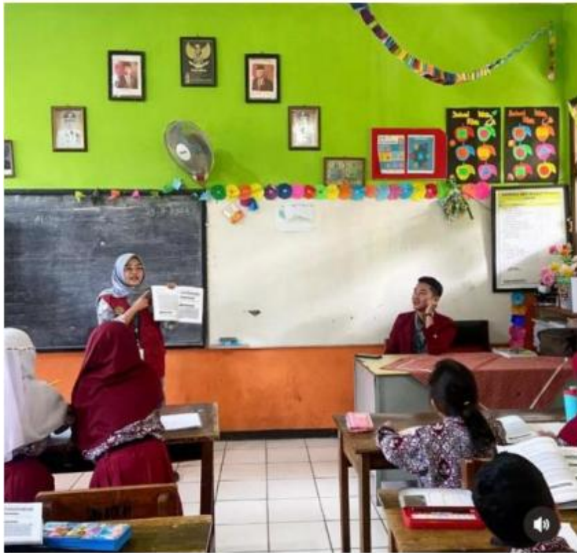
Gambar 6. pendampingan belajar