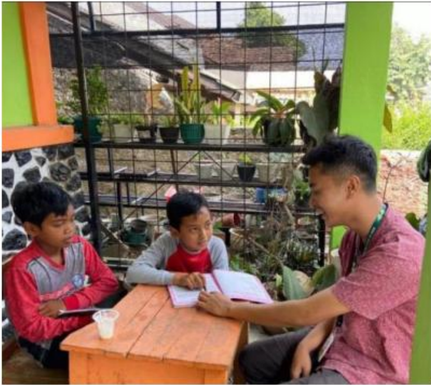
Gambar 5. pendampingan belajar