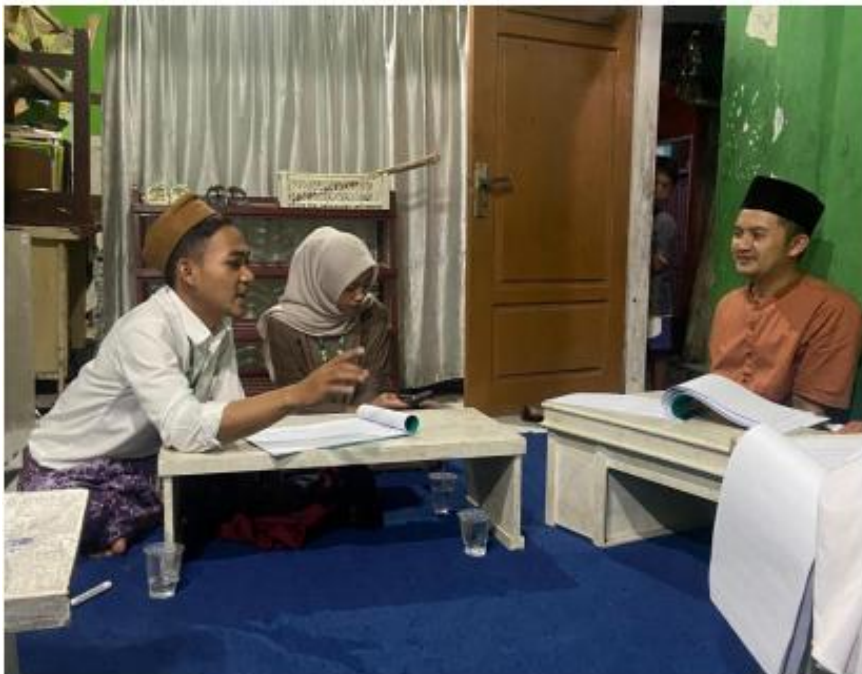
Gambar 4. Diskusi metode pembelajaran Al-Quran