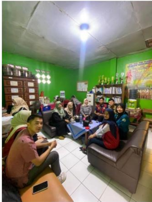
Gambar 3. Diskusi metode pengajaran membaca