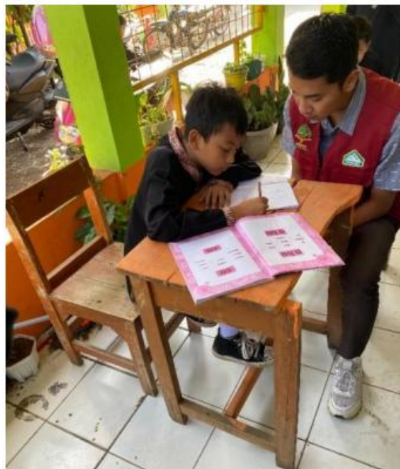
Gambar 2. Membimbing kemampuan membaca siswa SDN 01 Batukarut

Subyek pengabdian ini adalah Mahasiswa dan Dosen Universitas Islam Nusantara (UNINUS) dengan mitra pembimbing sekolah SDN 01 Batukarut. Target pada anak-anak di Sekolah Dasar Negeri 01 (SDN 01) Batukarut dan anak-anak di Taman Pendidikan Al-Quran (TPQ Al- Mubarak). Tempat dan lokasi pengabdian adalah di Sekolah Dasar Negeri 01 (SDN 01) Batukarut dan Taman Pendidikan Al-Quran (TPQ Al- Mubarak). Keterlibatan subyek dampingan dalam proses perencanaan dan pengorganisasian komunitas, metode atau strategi riset yang digunakan dalam mencapai tujuan yang diharapkan dan tahapan-tahapan kegiatan pengabdian masyarakat.