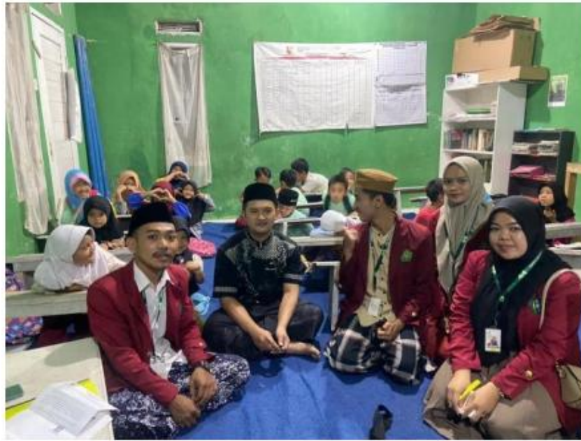
Gambar 4. Evaluasi PKM pembimbingan membaca