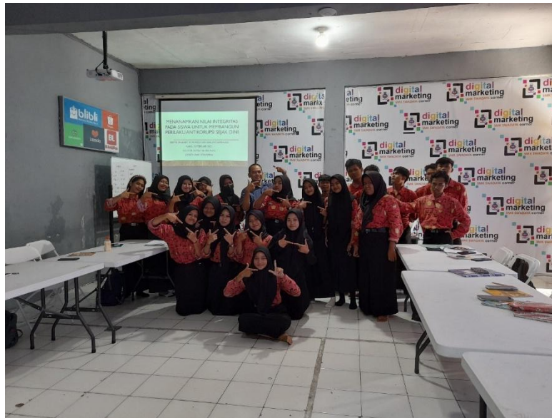
Gambar 4. Narasumber dan peserta

korupsi. Sesi pertama diawali dengan memberikan pre test kepada siswa untuk mengetahui seberapa jauh pemahaman tentang nilai-nilai anti korupsi. Sesi kedua dilanjutkan dengan ceramah dan tanya jawab. Sesi berikutnya mengulas mengenai indicator korupsi dari Komisi Pemberantasan Korupsi. Sesi terakhir yaitu diberikan post test untuk mengetahui seberapa jauh pemahaman yang sama setelah mendapatkan penulhan dari pengabdian.