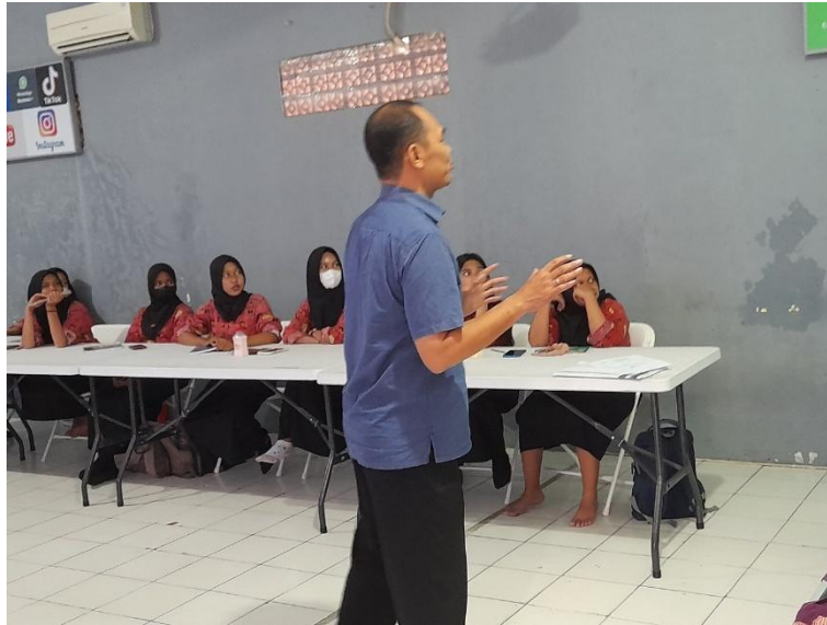
Gambar 3. penyampain materi PKM

Telah disebutkan di muka bahwa perilaku korupsi di Indonesia telah mencapai pada tarap yang memprehatinkan. Indonesia sudah berada pada urutan 5 teratas di Asia Tenggara menjadi negara yang terkorup . Menyikapi fenomena korupsi yang makin parah ini, dunia pendidikan pun mulai melakukan pembenahan-pembenahan untuk menjawab tantangan derasnya arus korupsi.