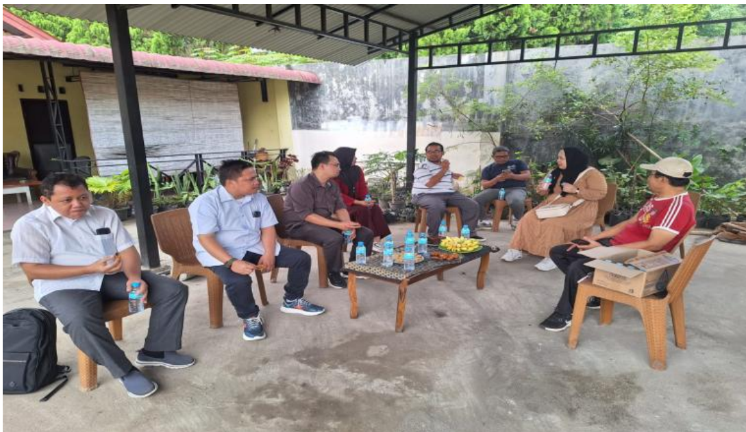
Gambar 3. Survei Awal Ke Lokasi

pelaku usaha dalam menentukan biaya produksi secara akurat. Tahap persiapan dimulai dengan identifikasi permasalahan melalui survei dan wawancara, yang menunjukkan bahwa banyak pengusaha anggur kesulitan dalam menetapkan harga pokok produksi. Untuk mengatasi hal ini, tim pengabdian menyusun rencana kegiatan yang mencakup materi tentang konsep dasar harga pokok, studi kasus, serta metode pelatihan yang menggabungkan teori dan praktik. Berbagai sumber daya seperti modul pelatihan, perangkat lunak akuntansi sederhana, dan spanduk turut dipersiapkan guna mendukung efektivitas pelatihan.