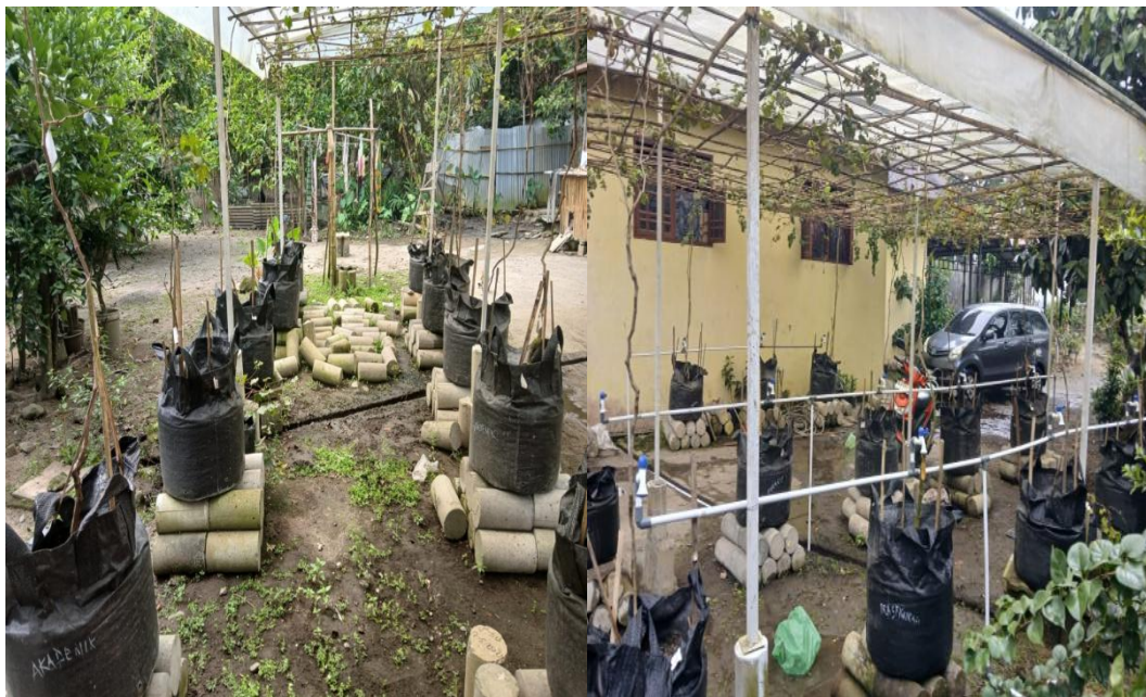
Gambar 1. Lahan Tanaman Anggur

Saat ini, semakin banyak petani yang tertarik melakukan budidaya anggur. Anggur bukan hanya menghasilkan buah yang lezat dan segar, tetapi juga memiliki banyak manfaat bagi kesehatan. Anggur adalah salah satu buah dengan harga jual yang mahal. Sehingga budidaya anggur dapat menjadi peluang bisnis yang menjanjikan. Dari hasil perkebunan anggur ini, Petani anggur Desa Bangun Sari dapat memperoleh penghasilan yang dapat diperhitungkan. Dengan proses budidaya yang baik harapannya, para petani anggur dapat menopang perekonomian keluarga melalui budidaya anggur. Di dukung dengan Desa Bangun Sari sebagian besar masyarakatnya bergerak di bidang pertanian dan peternakan.