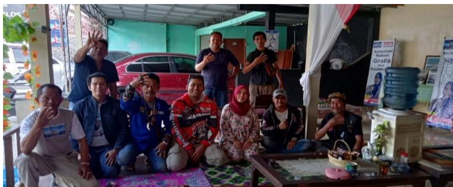
Gambar 2. Rapat persiapan PKM

Kegiatan penyuluhan ini juga sejalan dengan upaya pemerintah dalam mendorong pertumbuhan ekonomi inklusif dan berkelanjutan (Kanivia et al., 2022). Pemerintah Indonesia, melalui berbagai kebijakan dan program, telah mendorong pengembangan koperasi syariah sebagai bagian dari sistem ekonomi nasional. Namun, upaya pemerintah ini perlu didukung oleh partisipasi aktif dari masyarakat. Tanpa pemahaman yang memadai, potensi koperasi syariah tidak akan dapat dimanfaatkan secara optimal. Oleh karena itu, kegiatan penyuluhan ini tidak hanya bertujuan untuk memberikan pengetahuan, tetapi juga untuk membangun kesadaran masyarakat tentang pentingnya koperasi syariah dalam mendukung perekonomian mereka.