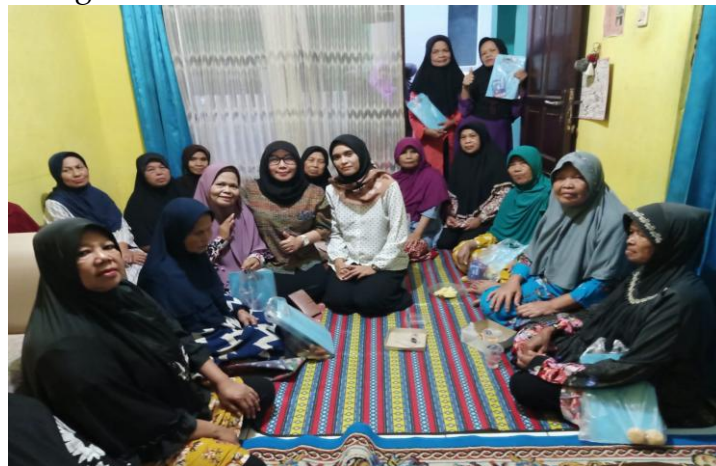
Gambar 5. Pendampingan dengan mitra PKM

Peserta pelaku UMKM, misalnya, menyadari bahwa koperasi syariah dapat menjadi sumber pembiayaan yang lebih adil dan terjangkau dibandingkan dengan lembaga keuangan konvensional. Mereka memahami bahwa koperasi syariah tidak menerapkan sistem bunga, yang seringkali memberatkan, melainkan menggunakan sistem bagi hasil yang lebih adil dan sesuai dengan prinsip syariah. Hal ini membuat mereka lebih tertarik untuk memanfaatkan koperasi syariah sebagai sarana untuk mengembangkan usaha mereka. Selain itu, peserta juga memahami bahwa koperasi syariah tidak hanya memberikan pembiayaan, tetapi juga memberikan pendampingan dan pelatihan untuk meningkatkan kapasitas usaha mereka. Dengan demikian, koperasi syariah tidak hanya menjadi sumber modal, tetapi juga menjadi mitra dalam mengembangkan usaha.