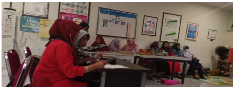
Gambar 3. Narasumber memberikan materi PKM

Evaluasi terhadap kegiatan penyuluhan ini menunjukkan bahwa terdapat peningkatan signifikan dalam pemahaman peserta tentang manfaat koperasi syariah. Sebelum penyuluhan, sebagian besar peserta hanya memiliki pengetahuan yang terbatas tentang koperasi syariah (Hidayat, 2019). Namun, setelah mengikuti penyuluhan, peserta menunjukkan pemahaman yang lebih baik tentang prinsip-prinsip syariah yang mendasari koperasi, manfaat koperasi syariah bagi perekonomian mereka, serta cara-cara untuk memanfaatkan koperasi syariah secara optimal. Selain itu, peserta juga menunjukkan antusiasme yang tinggi untuk terlibat dalam koperasi syariah, baik sebagai anggota maupun sebagai pengurus (Abdurohman et al., 2022).