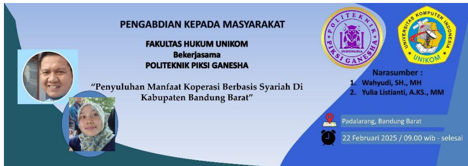
Gambar 1. Spanduk kegiatan PKM

Penyuluhan tentang manfaat koperasi syariah menjadi langkah strategis untuk meningkatkan literasi keuangan syariah di masyarakat. Literasi keuangan syariah tidak hanya mencakup pemahaman tentang produk dan layanan keuangan syariah (Suprianto & Rusdi, 2024), tetapi juga tentang nilai-nilai dan prinsip-prinsip yang mendasarinya. Dalam konteks koperasi syariah, literasi ini mencakup pemahaman tentang konsep bagi hasil, transparansi, keadilan, serta tanggung jawab sosial (Bakar & Husnan, 2021). Dengan pemahaman yang baik, masyarakat dapat memanfaatkan koperasi syariah secara optimal, baik sebagai sumber pembiayaan, sarana investasi, maupun sebagai wadah untuk meningkatkan kesejahteraan bersama.