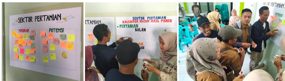
Gambar 3. Pelaksanaan Rapid Rural Appraisal (RRA) di Desa Sesaot

Alat RRA lain yang digunakan adalah kalender musim, dimana masyarakat diminta untuk merumuskan masa tanam dan masa panen dari masing-masing komoditas yang ada di Desa Sesaot. Alat ini berfungsi untuk memetakan atraksi wisata seperti petik buah ataupun atraksi menanam tanaman sebagai bentuk pengalaman berwisata ala masyarakat desa. Berbagai ide bermunculan dari masyarakat mengenai atraksi wisata yang bisa dikolaborasikan dengan memahami time schedule dari kalender musim tersebut. Menurut mereka, kegiatan RRA ini adalah hal baru bagi mereka dan sangat bermanfaat karena ketika mereka duduk bersama saling melengkapi ide, pemikiran dan gagasan maka akan bermunculan topik-topik baru dalam pengembangan desa. Hal ini juga disadari Pemerintah Desa untuk dapat digunakan sebagai metode dalam mengajak masyarakat desa berpartisipasi dari tahap perencanaan hingga monitoring dan evaluasi program.