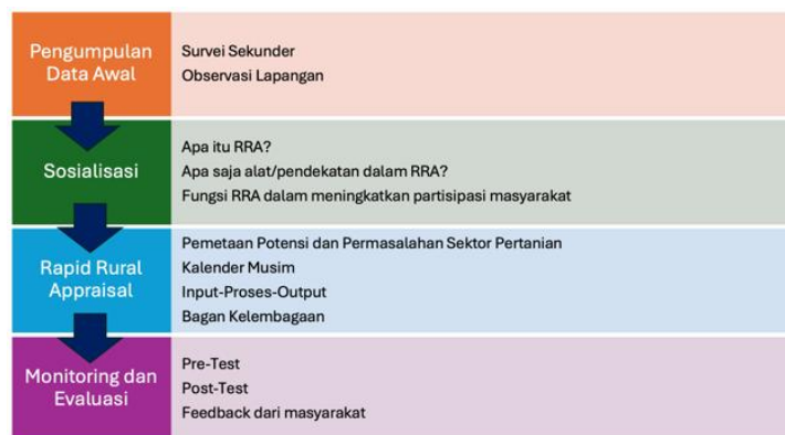
Gambar 2. Metode Pelaksanaan Pengabdian kepada Masyarakat

Metode tahapan pelaksanaan terdiri dari pengumpulan data awal, sosialisasi, penerapan Rapid Rural Appraisal (RRA), monitoring dan evaluasi. Pengumpulan data awal digunakan untuk mengetahui kondisi eksisting Desa Sesaot secara menyeluruh, seperti kondisi sektor pariwisata sebagai faktor pemantik bagi perkembangan desa, kondisi sektor pertanian, sektor industri kecil menengah hingga kelembagaan lokal yang ada. Pengetahuan dasar tim pengabdian mengenai wilayah sasaran kegiatan pengabdian akan menjadi bahan untuk melakukan crosscheck dan juga mengarahkan partisipan dalam setiap proses kegiatan.