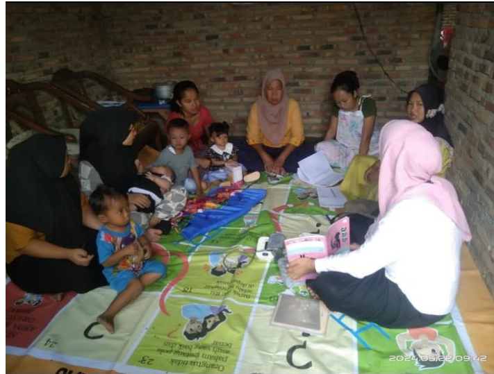
Gambar 1. Kegiatan posyandu pada rumah salah seorang warga

Lokasi posyandu berada di Dusun IV Desa Sei Sijeggi, Kecamatan Perbaungan, Kabupaten Serdang Bedagai, Sumatera Utara. Berjarak sekitar 49,4 km dari Politeknik Negeri Medan. Berikut dokumentasi kegiatan posyandu yang pernah dilakukan pada Gambar 1.