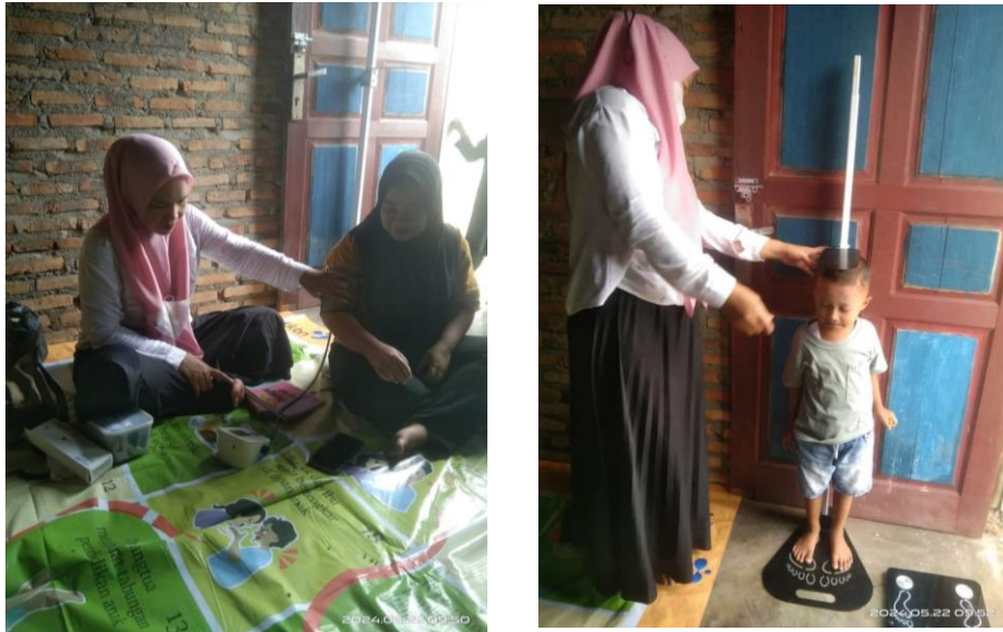
Gambar 2. Kegiatan posyandu pada rumah salah seorang warga

menginformasikan kembali tempat kepada seluruh ibu dan anak yang mau ke posyandu. Selain itu, kondisinya di dalam ruangan yang terbatas sehingga kondisinya panas sekali.