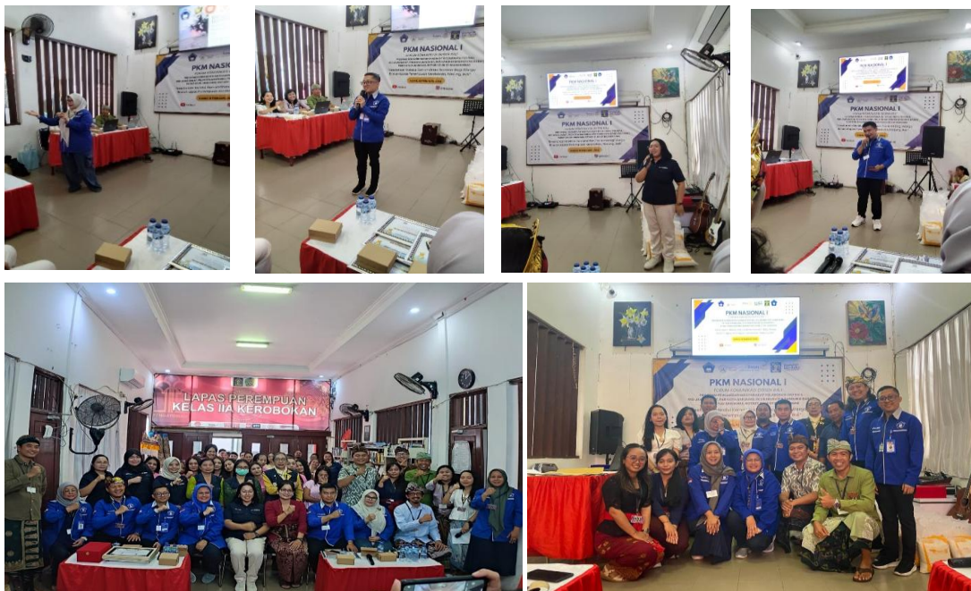
Gambar 2. Dokumentasi kegiatan

Peningkatan motivasi peserta tidak hanya terlihat dari hasil angket, tetapi juga dari ekspresi verbal dan non-verbal selama kegiatan berlangsung. Banyak peserta yang sebelumnya pasif menjadi lebih aktif dalam sesi tanya jawab dan praktik. Hal ini menunjukkan bahwa pemberdayaan yang menyentuh aspek psikologis dan sosial secara simultan lebih efektif daripada pendekatan tunggal.