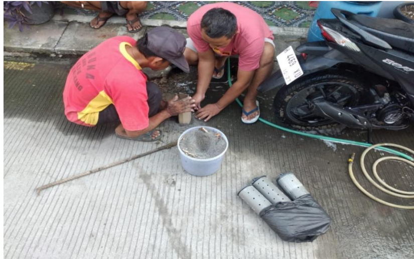
Gambar 4. Pemasangan biopori