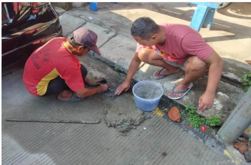
Gambar 5. Adukan semen untuk memperkuat biopori

Berkurangnya lahan terbuka karena kepadatan penduduk, mengakibatkan permukaan air tanah turun. Pori-pori tanah berkurang yang diakibatkan oleh proses pemadatan pendirian bangunan seperti pemukiman, sekolah, tempat usaha, dan sebagainya menyebabkan daya serap air tanah menurun (Pasaribu et al., 2023). Penutupan lahan menjadi salah satu penyebab terganggunya konservasi air. Salah satu usaha menjaga konservasi air adalah pembuatan biopori (Fitri et al., 2023). Aji et al., (2020), penggunaan sampah sisa rumah tangga di dalam biopori dapat meningkatkan kapasitas penyimpanan air tanah sehingga kualitas lingkungan semakin membaik (Chaireni et al., 2020).