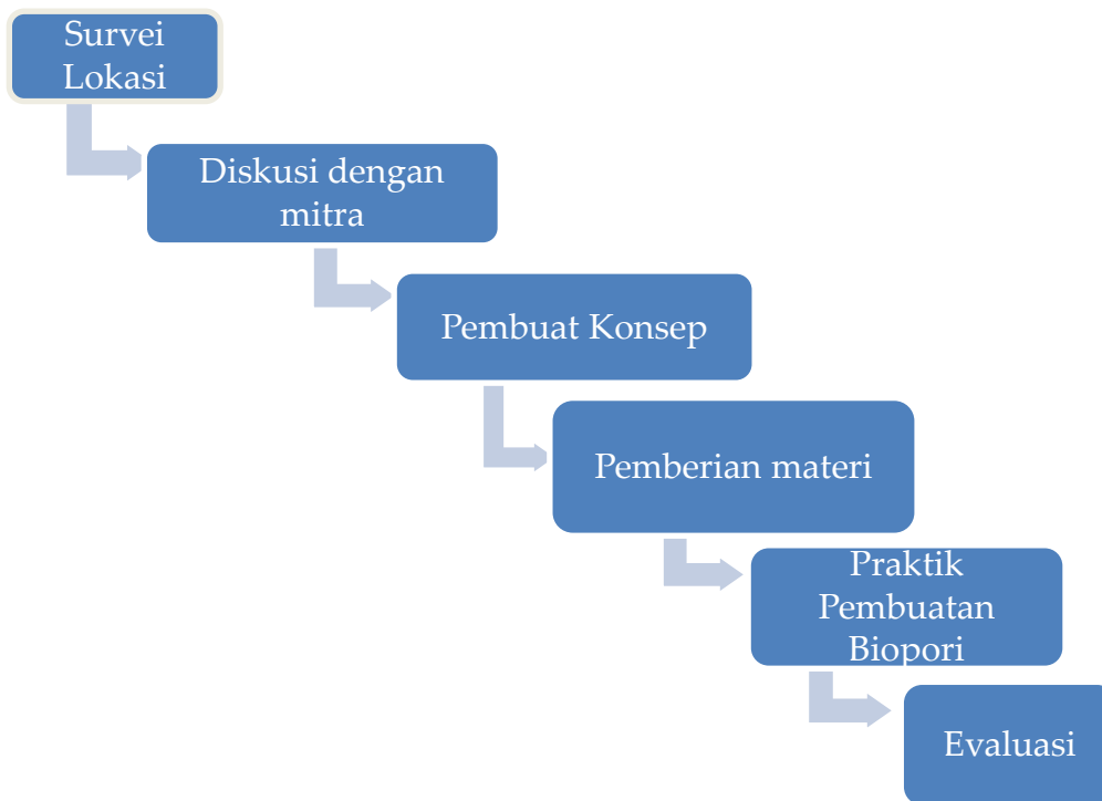
Gambar 1. Diagram metode pengabdian