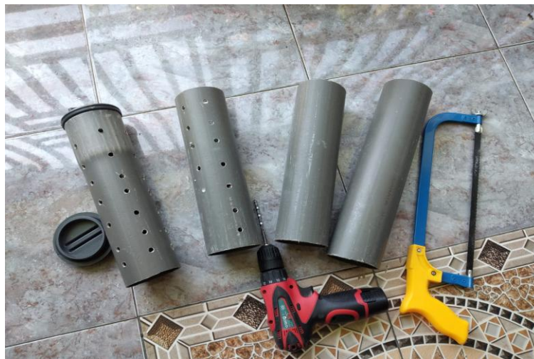
Gambar 3. Peralatan biopori

Persiapan peralatan wajib dilakukan setelah penentuan lokasi. Peralatan biopori meliputi pipa pralon yang sudah dilubangi dengan mata bor, bor listrik untuk melubangi pipa, gergaji untuk memotong pipa, meteran, spidol, linggis untuk membuat lubang di tanah, bor tanah (menggali tanah untuk memasang pipa), penutup pipa biopori (Gambar 3).