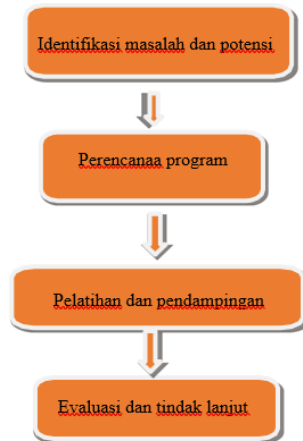
Gambar 1. Diagram Alur Pengabdian

Melalui tahapan-tahapan ini, diharapkan anggota PKK tidak hanya memiliki keterampilan baru, tetapi juga mampu mengembangkan usaha mandiri yang berdampak pada peningkatan kesejahteraan keluarga dan lingkungan yang lebih lestari.