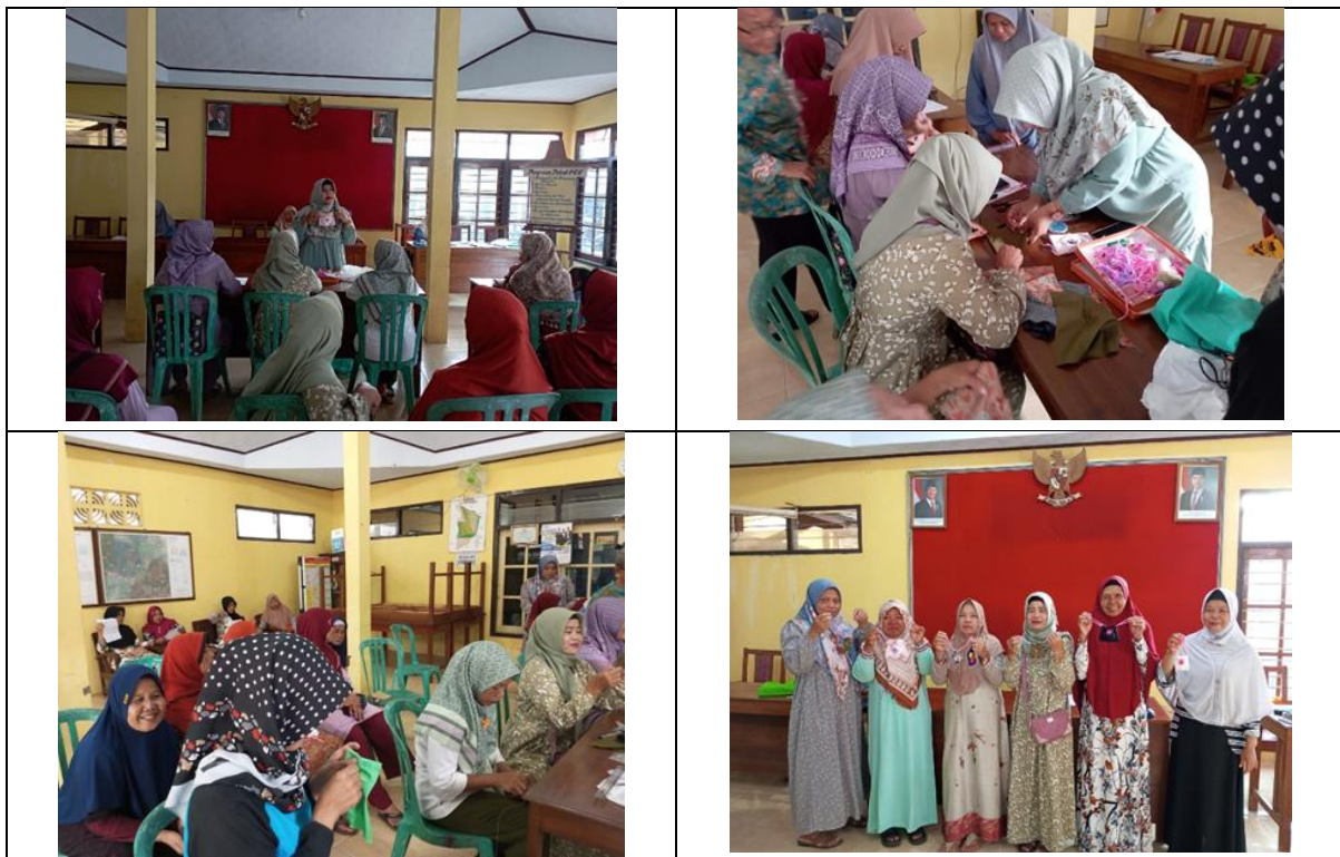
Gambar 3. Pelaksanaan Pembuatan Pouch

Pengabdian kepada masyarakat ini bertujuan untuk meningkatkan keterampilan anggota PKK Desa Kaliputih melalui pemanfaatan kain perca menjadi produk kerajinan yang memiliki nilai ekonomis. Hasil dari kegiatan ini dianalisis berdasarkan tiga aspek utama: (1) peningkatan keterampilan teknis, (2) partisipasi dan motivasi anggota PKK, serta (3) potensi keberlanjutan program.