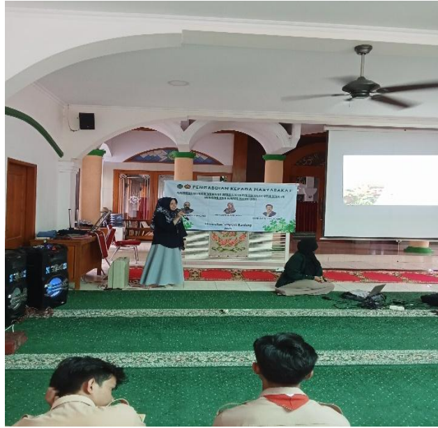
Gambar 1. Pemetaan Awal