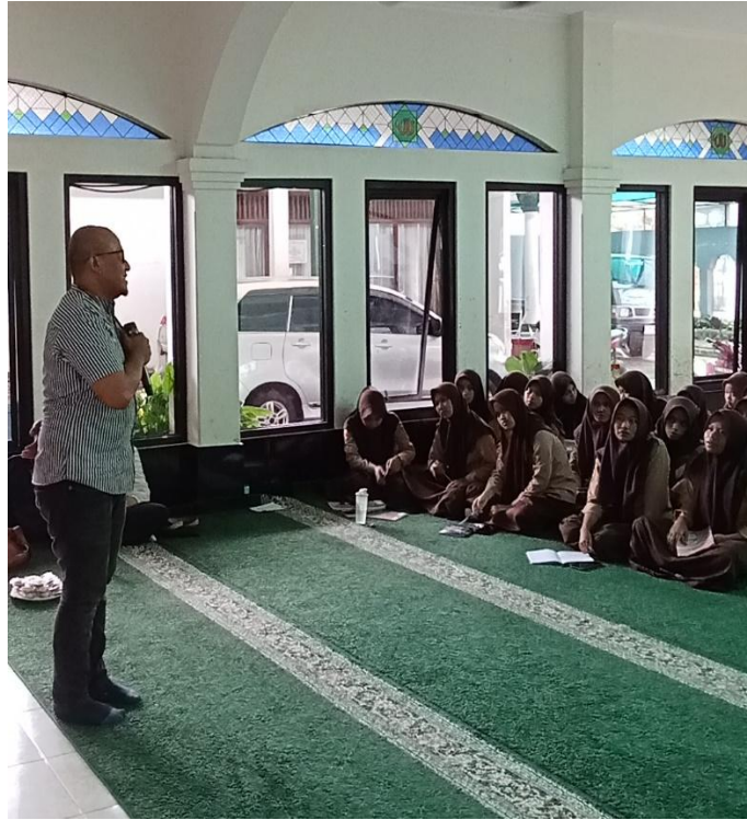
Gambar 2. Pelaksanaan PKM