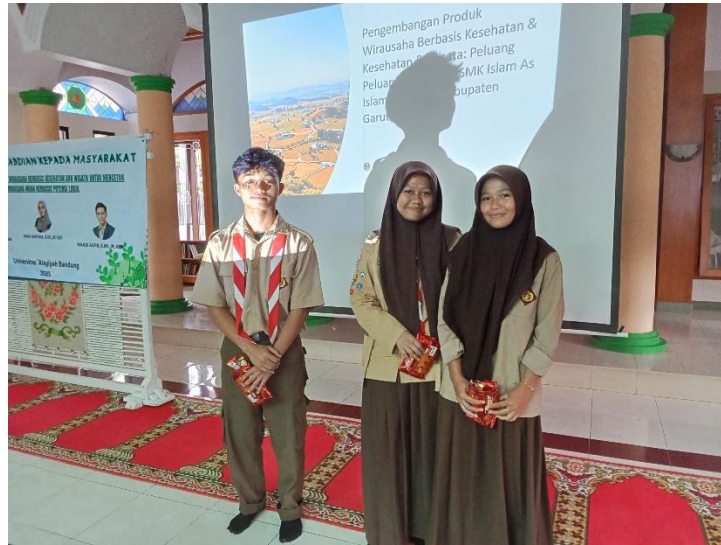
Gambar 3. Implementasi Kegiatan