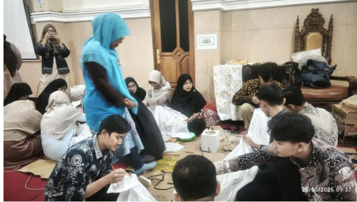
Gambar 2. Aktivitas Menggambar Sketsa Batik Pondok Pesantren Khoirul Huda 1 Surabaya

Pada sesi keempat, kegiatan difokuskan pada praktik membatik tulis secara langsung menggunakan malam dengan alat canting. Peserta diajak mencoba menggunakan canting dengan berbagai ukuran dan jenis, serta memahami karakteristik bahan malam yang digunakan. Santriwati mempelajari teknik membatik tulis menggunakan malam dan canting. Dengan bimbingan intensif, peserta mulai mampu mengontrol aliran malam pada kain, menentukan ketebalan garis, dan menjaga kerapian pola motif. Ini merupakan tahap penting dalam membentuk keterampilan teknis dasar yang dibutuhkan dalam membatik tulis. Dibutuhkan waktu adaptasi pada dua sesi pertama, namun di sesi keempat, sebagian besar peserta menunjukkan peningkatan signifikan dalam hal ketepatan penggunaan canting dan pengendalian malam. Hasil evaluasi menunjukkan bahwa 80% peserta mampu menyelesaikan kain batik ukuran kecil (40x40 cm) dengan motif buatan sendiri.