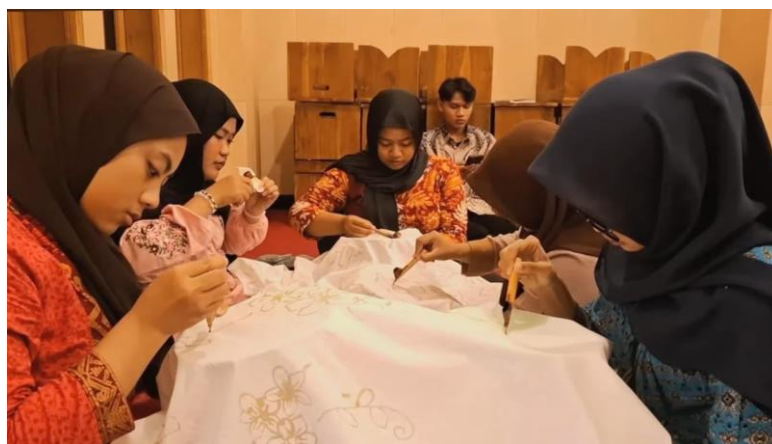
Gambar 3. Aktivitas Mencanting dengan Lilin Malam Pondok Pesantren Khoirul Huda 1 Surabaya

Pada sesi keempat, kegiatan difokuskan pada praktik membatik tulis secara langsung menggunakan malam dengan alat canting. Peserta diajak mencoba menggunakan canting dengan berbagai ukuran dan jenis, serta memahami karakteristik bahan malam yang digunakan. Santriwati mempelajari teknik membatik tulis menggunakan malam dan canting. Dengan bimbingan intensif, peserta mulai mampu mengontrol aliran malam pada kain, menentukan ketebalan garis, dan menjaga kerapian pola motif. Ini merupakan tahap penting dalam membentuk keterampilan teknis dasar yang dibutuhkan dalam membatik tulis. Dibutuhkan waktu adaptasi pada dua sesi pertama, namun di sesi keempat, sebagian besar peserta menunjukkan peningkatan signifikan dalam hal ketepatan penggunaan canting dan pengendalian malam. Hasil evaluasi menunjukkan bahwa 80% peserta mampu menyelesaikan kain batik ukuran kecil (40x40 cm) dengan motif buatan sendiri.