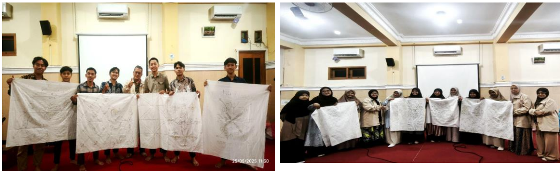
Gambar 4. Hasil Kreasi Batik Santriwan dan Santriwati Pondok Pesantren Khoirul Huda 1 Surabaya yang sudah dicanting

Dari hasil tersebut terlihat bahwa metode pelatihan praktik langsung dan pendekatan partisipatif memberikan dampak positif terhadap penguasaan keterampilan membatik. Santriwati dan Santriwan tidak hanya memahami teori, namun juga mampu menerapkannya dalam praktik dengan kualitas yang meningkat. Hasil analisis yang berkaitan dengan pertanyaan pengabdian. Setiap hasil pengabdian harus dibahas. Pembahasan berisi pemaknaan hasil dan perbandingan dengan teori dan/atau hasil pengabdian sejenis.