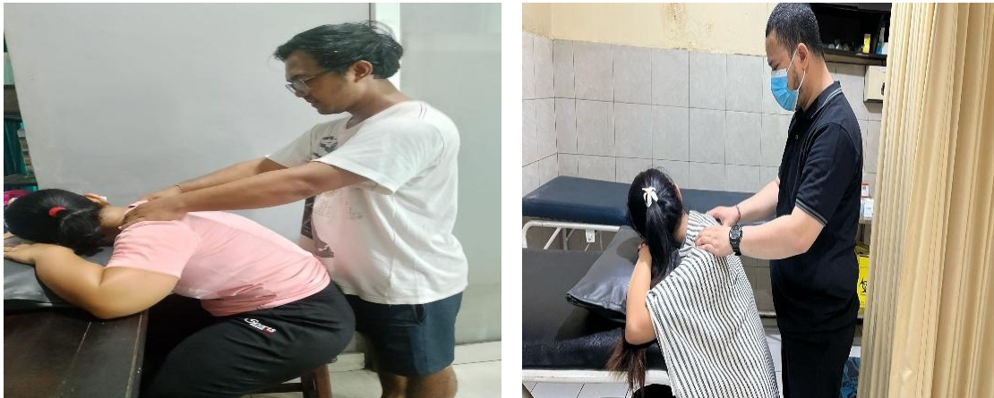
Gambar 3. Inform concent dan Demontrasi pada pasien

Berdasarkan gambar diatas dapat dilihat bahwa tim pelaksana pengabdian kepada masyarakat telah melakukan pelatihan pijat oksitosin kepada suami ibu hamil trimester III. Sebelum dilakukan pelatihan, tim pengabdi melakukan edukasi terlebih dahulu dengan menggunakan booklet pijat oksitosin sebagai panduan dalam melakukan pelatihan pijat oksitosin. Setelah itu dilakukan pelatihan cara melakukan pijat oksitosin agar bisa diterapkan saat di rumah dengan tujuan ibu lebih percaya diri dalam memberikan ASI eksklusif kepada bayinya nanti. Hasil dari kegiatan ini dapat dijelaskan dengan presentase jawaban benar pengetahuan suami ibu hamil trimester III sebelum dan setelah dilakukan edukasi dan pelatihan pijat oksitosin pada kuisisioner masing – masing item pertanyaan. Tabel 1 menjelaskan secara terperinci tentang hasil yang didapatkan yaitu sebagai berikut: