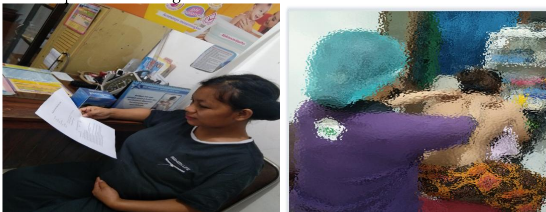
Gambar 2. Inform concent dan Demonstrasi pada pasien

Pengabdian kepada Masyarakat dilaksanakan dengan baik. Pada tahap ini, pelaksana pengabdian kepada masyarakat telah menganalisis situasi dan meminta izin ke Direktur Klinik Pedungan Medika Denpasar. Kegiatan tersebut mencakup penyuluhan dan pelatihan kepada suami pasien tentang pijat oksitosin di trimester ketiga dengan menggunakan bahan dan media yang telah disediakan.. Semua bidan dan terlibat dalam pelaksanaan kegiatan tersebut. Booklet juga telah diberikan kepada peserta untuk mereka praktekkan di rumah mereka sendiri. Dokumentasi pelaksanaan dapat dilihat sebagai berikut: