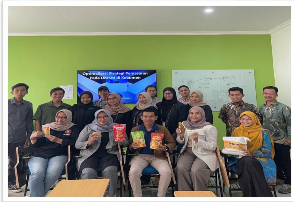
Gambar 2. Kegiatan Pelatihan (narasumber dan peserta)

digital. Selama kegiatan, para peserta sangat tertarik dengan materi yang diberikan, terutama tentang sesi tentang branding, marketing digital, dan penggunaan platform online untuk promosi dan penjualan.