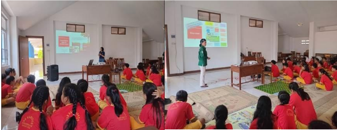
Gambar 2. Penyampaian materi di kelas tentang lubang resapan Biopori kepada Siswa/siswi SD Kanisius Gendongan, Kota Salatiga

Kegiatan introduksi biopori pada siswa/siswa SD Kanisius Gendongan Kota Salatiga dihadiri sekitar 46 siswa/siswi kelas 6. Penjelasan awal terkait apa, mengapa, dan bagaimana tentang lubang resapan biopori dilakukan di dalam kelas (Gambar 2).