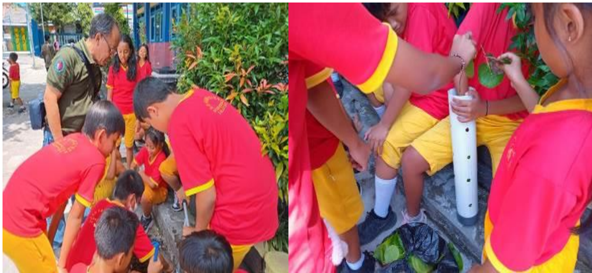
Gambar 3. Siswa/siswi SD Kanisius Gendongan, Kota Salatiga bergotong-royong membuat resapan Biopori

Pada saat praktik, dilakukan penjelasan proses bekerjanya lubang biopori sebagai jalur masuk air hujan untuk mengurangi genangan di sekitar sekolah dan tempat membuat kompos. Karakter untuk bergotong-royong dan bekerja sama tampak pada saat melakukan kegiatan bersama membuat lubang biopori, seperti disimpulkan dari Fitriani et al. , (2023) yakni pembuatan lubang resapan biopori pada siswa SD mendorong peningkatan pengetahuan, keterampilan, bahkan memperkuat kegotongroyongan antar siswa.