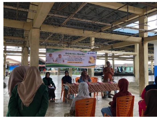
Gambar 3. Kata Sambutan