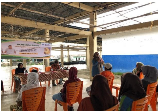
Gambar 4. Pemaparan Materi