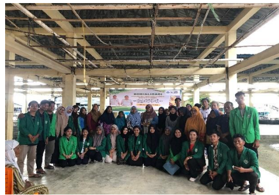
Gambar 5. Foto Bersama