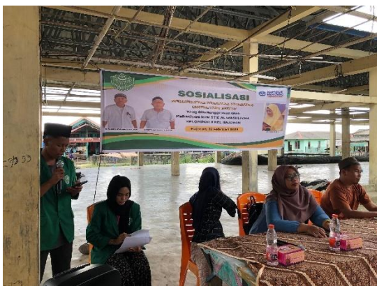
Gambar 2. Pembukaan Acara

Dengan adanya kegiatan sosialisasi ini, para warga Kelurahan Hajoran menjadi melek literasi digital. Hal ini tampak dari berbagai pertanyaan yang mereka ajukan selama sesi tanya jawab. Kegiatan ini berjalan dengan efektif, tertib dan peserta sangat antusias mengikuti setiap rangkaian acara. Untuk itu perlunya kegiatan-kegiatan pengabdian masyarakat lainnya yang megarah kepada pemberdayaan masyarakat desa melalui kelompok usaha sehingga dapat meningkatkan kesejahteraan masyarakat dan menggerakkan perekonomian desa (Kusrini, dkk; 2017) penting untuk ditindaklanjuti secara bertahap.