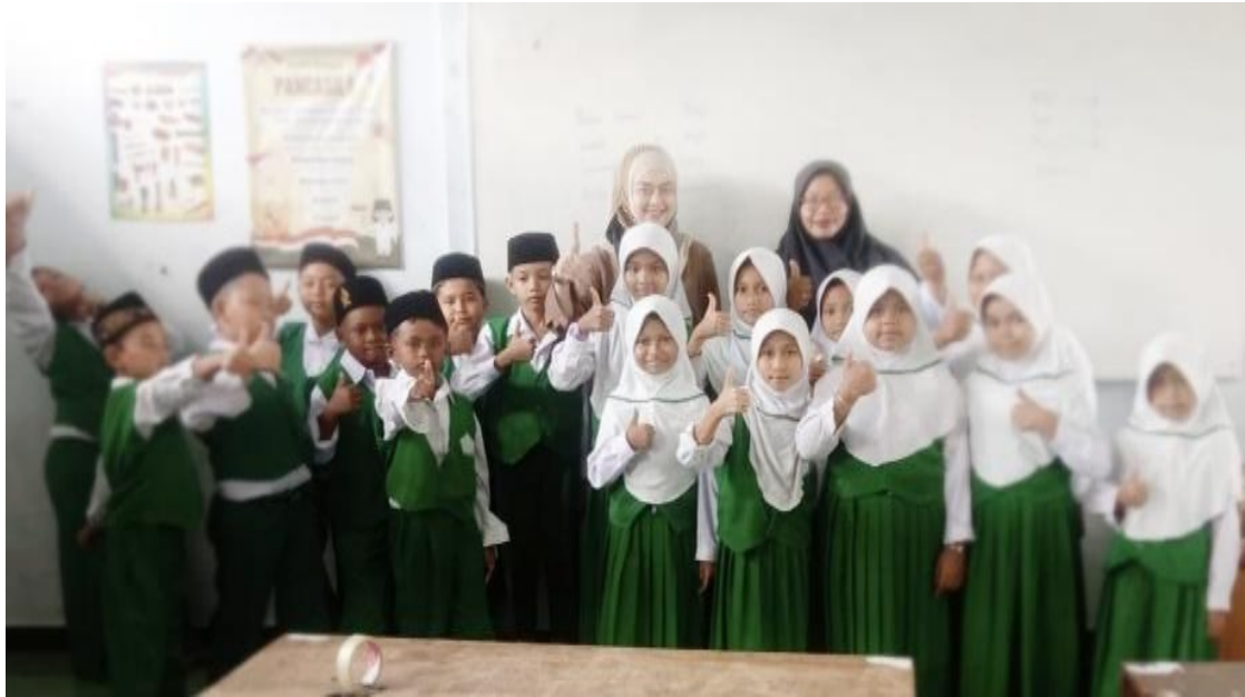
Gambar 2. Penyuluhan dan Edukasi Awal