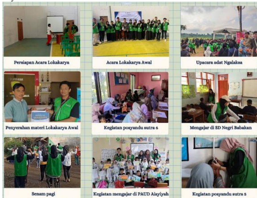
Gambar 2. Rangkaian kegiatan Coaching Literasi Digital Desa Sukasirnarasas

A. Implementasi Program Coaching Clinic pada UMKM dalam memahami dan menggunakan literasi digital