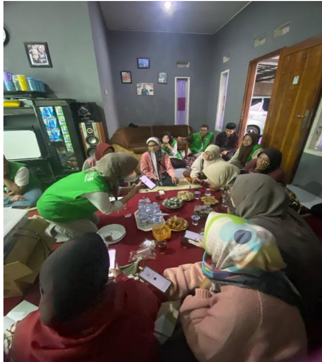
Gambar 3. Coaching Clinic on site - Sekretariat PKK Desa Sukasimarasa