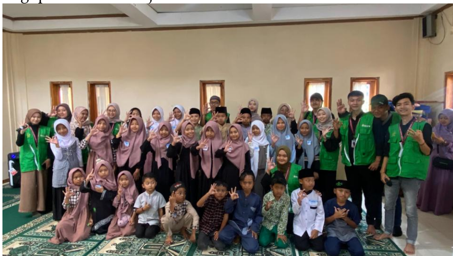
Gambar 4. Finalisasi PKM Desa Sukasirnarasa