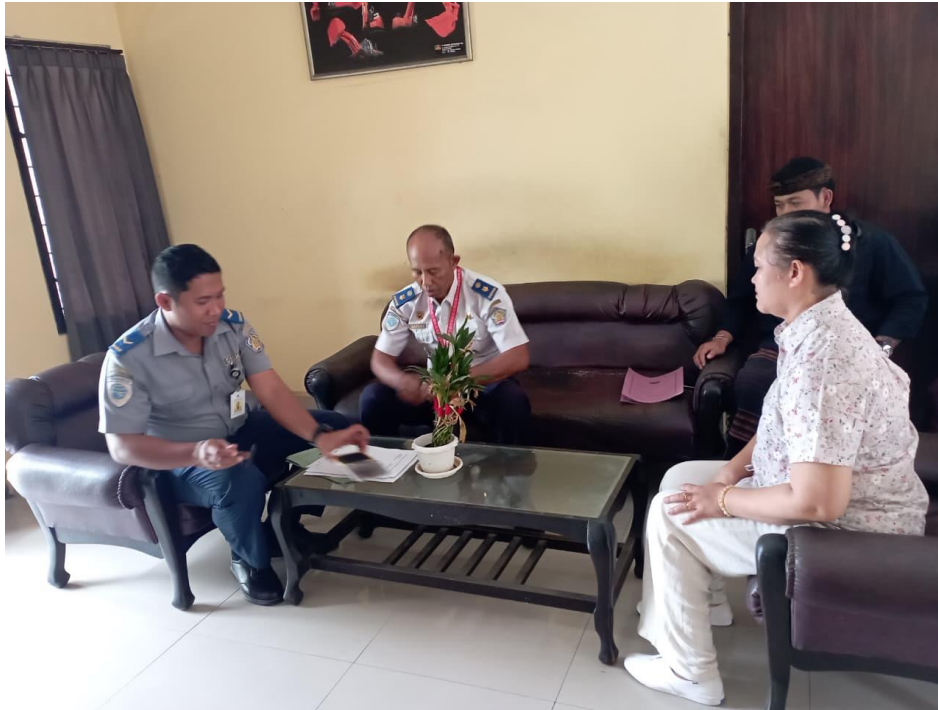
Gambar 4. Kegiatan Verifikasi Lapangan

Namun, berdasarkan hasil temuan, sinergi ini belum efektif karena adanya ketimpangan pemahaman teknologi dan hambatan geografis. Prinsip kesetaraan, meskipun memiliki atribut khusus, juga harus mempertahankan penekanan yang teguh pada kenyataan yang nyata (Lannyati et al., 2025). Hal ini mencerminkan pentingnya prinsip itikad baik dalam hukum perdata (Pasal 1338 KUHPerduta), di mana pihak pemilik usaha diharapkan memberikan data yang benar dan jujur, serta prinsip kesetaraan dalam hubungan hukum, yaitu negara (melalui Dishub) tidak boleh berada dalam posisi dominan, tetapi harus memfasilitasi agar pelaku usaha memiliki akses informasi dan sarana pengisian yang setara. Jika dibandingkan dengan teori administrasi hukum keperdataan, sebagaimana diajarkan dalam hukum perdata formal, maka Google Form dapat dianalogikan sebagai bentuk akta di bawah tangan, yang membutuhkan konfirmasi lebih lanjut melalui pemeriksaan lapangan sebagai bentuk verifikasi faktual. Dengan demikian, kedua instrumen tersebut seharusnya saling melengkapi dalam mewujudkan keabsahan dan legalitas kegiatan usaha.