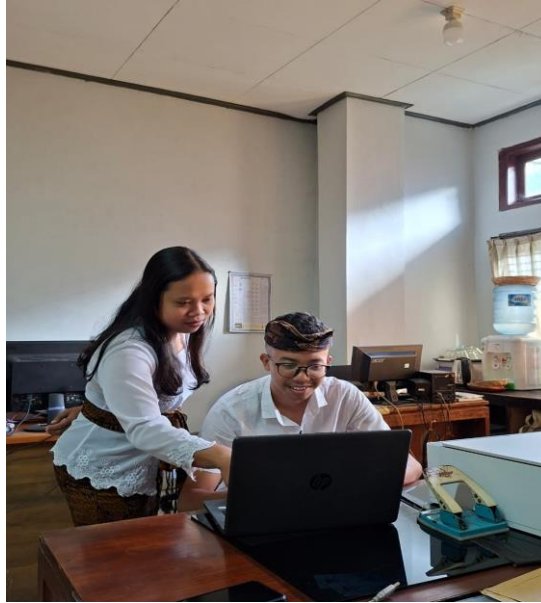
Gambar 3. Kegiatan Pembuatan Google Form

Kedua, dalam penggunaan Google Form sebagai alat bantu pengumpulan data, ditemukan bahwa masih banyak pemilik atau pengelola usaha angkutan yang tidak mengisi data secara lengkap dan akurat. Sebagian dari mereka mengaku belum memahami dengan baik mekanisme pengisian formulir digital, bahkan ada yang mengisi secara asal atau tidak mengunggah dokumen pendukung yang diminta, seperti surat izin trayek, bukti kepemilikan kendaraan, atau dokumen usaha lainnya. Fenomena ini mengindikasikan bahwa sinergi antara verifikasi lapangan dan Google Form belum berjalan secara optimal dalam menunjang legalitas usaha angkutan.