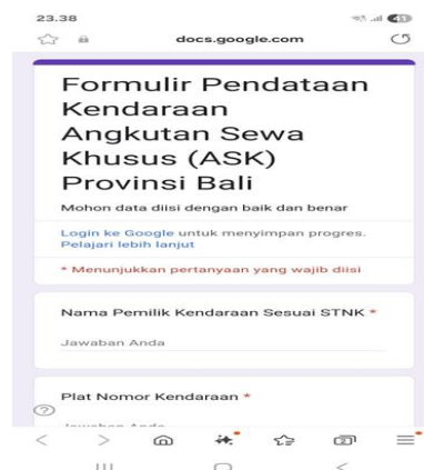
Gambar 2. Google Form Pendataan Angkutan Sewa Khusus (ASK)

Berdasarkan kegiatan Praktik Kerja Lapangan (PKL) yang dilaksanakan di Dinas Perhubungan Provinsi Bali, ditemukan beberapa fenomena yang menjadi tantangan dalam proses verifikasi legalitas usaha angkutan, khususnya dalam pelaksanaan verifikasi lapangan dan penggunaan Google Form sebagai sarana pelengkapan data administrasi. Pertama, dalam pelaksanaan verifikasi lapangan, terdapat kendala yang cukup signifikan terkait jarak lokasi usaha angkutan yang tersebar di berbagai wilayah kabupaten/kota, bahkan beberapa berada di wilayah terpencil. Hal ini menyebabkan keterbatasan waktu dan sumber daya dalam memastikan kesesuaian antara data yang diinput dengan kondisi nyata di lapangan. Oleh karena itu, strategi peningkatan kinerja perusahaan yang efektif harus mencakup investasi dalam pelatihan dan pengembangan karyawan, serta upaya untuk meningkatkan daya tarik perusahaan sebagai tempat kerja yang menarik bagi tenaga kerja yang berkualitas (Andini & Azzahra, 2023).