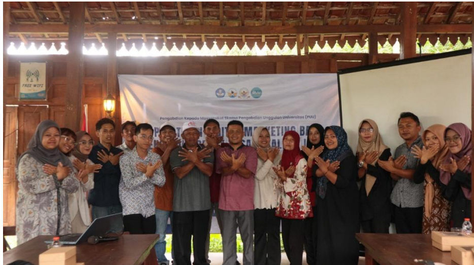
Gambar 5. Dokumentasi bersama peserta pelatihan

Dari hasil pre-test dan post-test yang dilakukan oleh tim kepada peserta, bahwa ditemukan adanya kenaikan rata-rata dari nilai pretest 94,6 dan hasil post-test 97,6.