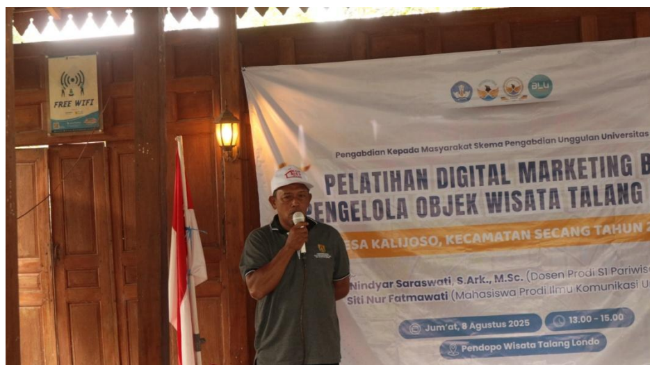
Gambar 2. Sambutan dari Kepala Desa Kalijoso

Pelaksanaan pengabdian masyarakat ini Jumat, 8 Agustus 2025 pada Pukul 13.00 s.d 15.30 WIB bertempat di Pendopo Talang Londo. Kegiatan pelatihan ini dimulai dengan registrasi mulai pukul 13.00 WIB. Setelah peserta berkumpul di Pendopo Talang Londo, kemudian acara dibuka dengan menyanyikan lagu Indonesia Raya dengan hikmat oleh seluruh peserta. Setelah menyanyikan lagu tersebut, acara dilanjutkan dengan sambutan oleh ketua tim pengabdian masyarakat dan Kepala Desa Kalijoso. Kepala Desa Kalijoso mengapresiasi kegiatan pengabdian masyarakat yang dilakukan Tim Dosen Universitas Tidar, khususnya dalam bidang pelatihan digital marketing. Hal ini karena objek wisata Talang Londo merupakan objek wisata yang masih dalam proses pembangunan sehingga masih perlu pendampingan dari berbagai pihak.