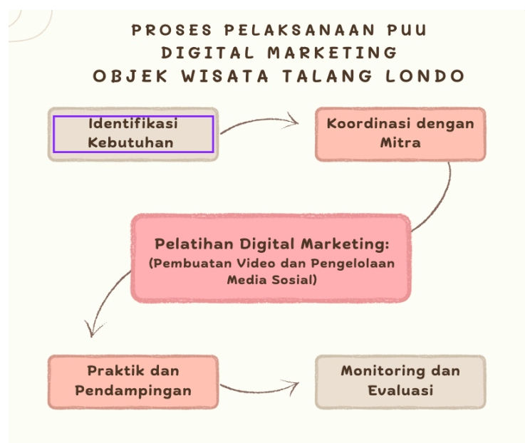
Gambar 1. Proses Pelaksanaan Pengabdian

Untuk lebih jelasnya dapat dilihat pada diagram alir berikut ini: