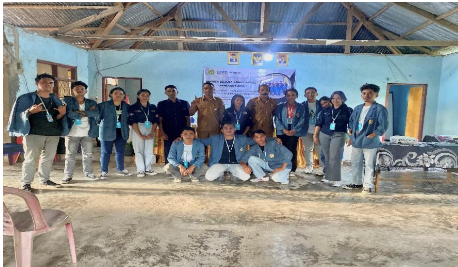
Gambar 3. Tim pelaksana kegiatan PKM

Pemanfaatan media blog sebagai sarana penyampaian informasi desa menunjukkan pergeseran paradigma komunikasi pemerintahan desa yang semula bersifat konvensional menuju sistem informasi berbasis daring. Pelatihan ini mendorong desa untuk lebih terbuka, informatif, dan partisipatif dalam menyampaikan capaian Pembangunan serta menggali potensi desa yang belum tergarap maksimal. Melalui pembuatan akun blog dan penyusunan profil desa yang terdokumentasi secara screencasting, aparat desa memiliki panduan yang konkret untuk menduplikasi proses serupa dalam skala yang lebih luas, misalnya membuat artikel berita desa, laporan kegiatan, atau agenda musyawarah desa yang dipublikasikan secara terbuka.