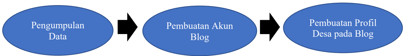
Gambar 1. Alur Kegiatan