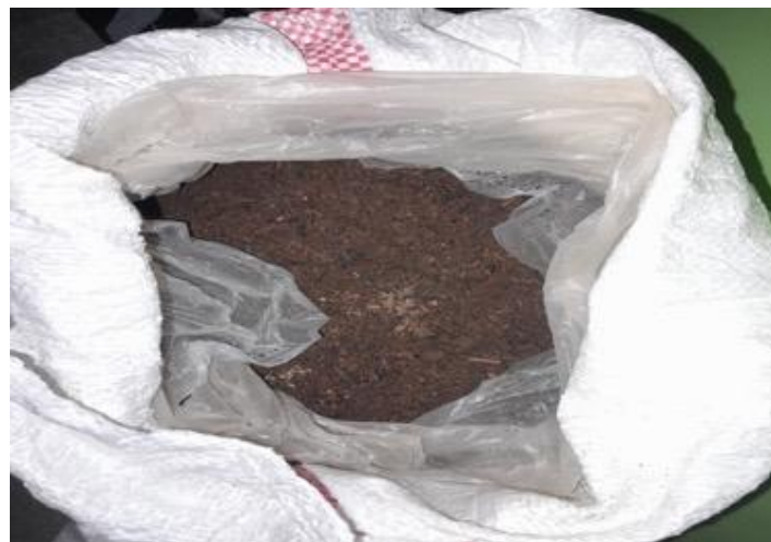
Gambar 2. Media tanam