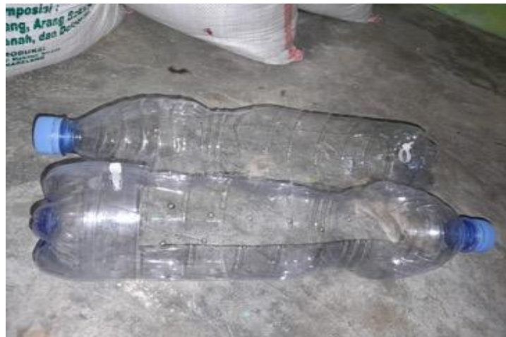
Gambar 2. Botol

dilakukan dengan memotong bagian tengah botol bekas air mineral membentuk cekungan menyerupai bentuk perahu. Setelah dibentuk menyerupai perahu, botol bekas di lubangi bagian bawahnya dan bagian kanan kiri menggunakan paku yang dipanaskan. Pembuatan lubang di bagian bawah bertujuan agar air dapat keluar atau mengalir kebawah dengan baik. sedangkan pemuatan lubang di samping kanan kiri untuk memudahkan dalam pemasangan tali. Pemanfaatan limbah plastik seperti botol dilakukan agar dapat mengurangi volume sampah plastik yang sulit terurai dan berpotensi mencemari lingkungan (Utami dkk., 2020).