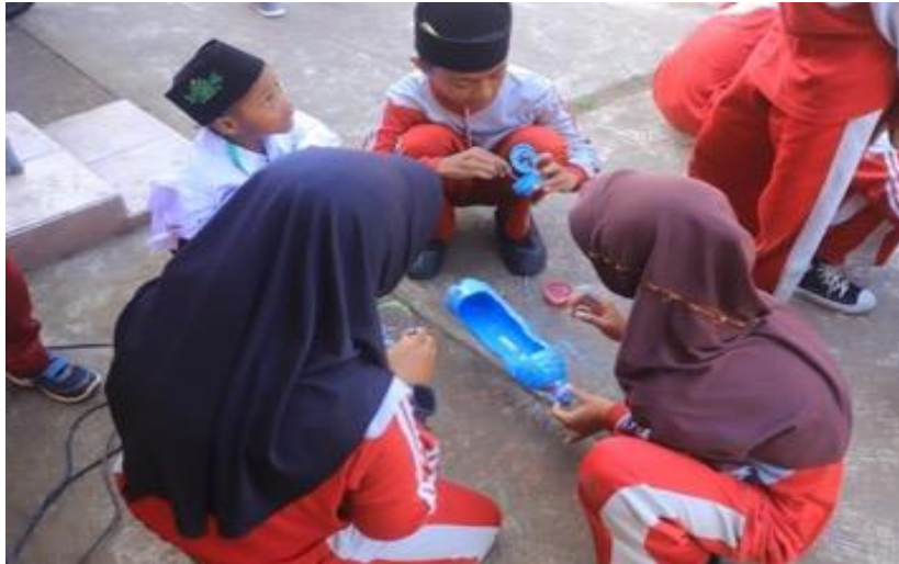
Gambar 5. Pengecatan Botol

Kegiatan praktik mencakup penyiapan penggunaan botol plastik sebagai wadah media tanam, pengecatan botol plastik dan langkah-langkah penanaman pakcoy serta instruksi merawat tanaman yang tumbuh melalui sistem vertikultur. Langkah pertama dilakukan dengan mengecat botol plastik bekas menggunakan cat, hal ini bertujuan untuk meningkatkan kreativitas peserta didik. Pengecatan dilakukan selama kurang lebih 1 jam kemudian botol dikeringkan dibawah sinar matahari. Langkah kedua adalah pengisian media tanam ke dalam botol, media tanam dimasukkan ke dalam botol plastik \frac{1}{3} dari volume botol plastik. Media tanam yang digunakan berupa campuran tanah dengan pupuk kandang, penambahan pupuk kandang sebagai media tanam dikarenakan untuk meningkatkan daya ikat tanah terhadap air (Yuliansah dkk., 2016). Langkah ketiga adalah memberi lubang tanam dengan jarak 5 - 10 cm tiap tanam nya, setelah memberi lubang tanam dilakukan kegiatan penanaman bibit tanaman pakcoy. Bibit pakcoy yang dipilih untuk penanaman adalah bibit yang sehat, tidak ada kerusakan fisik dan berumur 1-2 minggu setelah semai (Hasikin dkk., 2017).