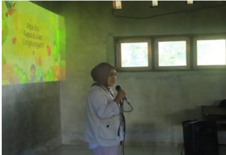
Gambar 4. Penyampaian materi

dengan vertikultur dan manfaat vertikultur sebagai praktik nyata kepedulian lingkungan sehingga siswa dan siswi mendapatkan ilmu pengetahuan baru dan termotivasi untuk terlibat dalam praktik menanam secara vertikultur (Imanta dkk., 2022). Sosialisasi dilakukan dengan pemaparan materi dan interaksi dengan audiens berupa tanya jawab kepada siswa siswi kelas 4,5, dan 6.