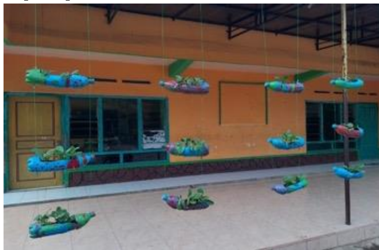
Gambar 7. Hasil Pembuatan Vertikultur

Langkah keempat atau langkah terakhir adalah penyusunan vertikultur secara bertingkat dan peletakkan vertikultur di depan ruang kelas 1 dan 2. Setelah pelaksanaan selesai, peserta didik dihimbau untuk melakukan penyiraman ataupun perawatan terhadap tanaman pakcoy tersebut agar tanaman tersebut dapat terus tumbuh hingga dapat dipanen.