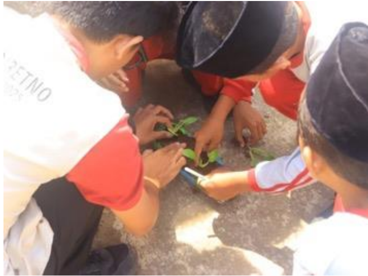
Gambar 6. Penanaman

Langkah keempat atau langkah terakhir adalah penyusunan vertikultur secara bertingkat dan peletakkan vertikultur di depan ruang kelas 1 dan 2. Setelah pelaksanaan selesai, peserta didik dihimbau untuk melakukan penyiraman ataupun perawatan terhadap tanaman pakcoy tersebut agar tanaman tersebut dapat terus tumbuh hingga dapat dipanen.