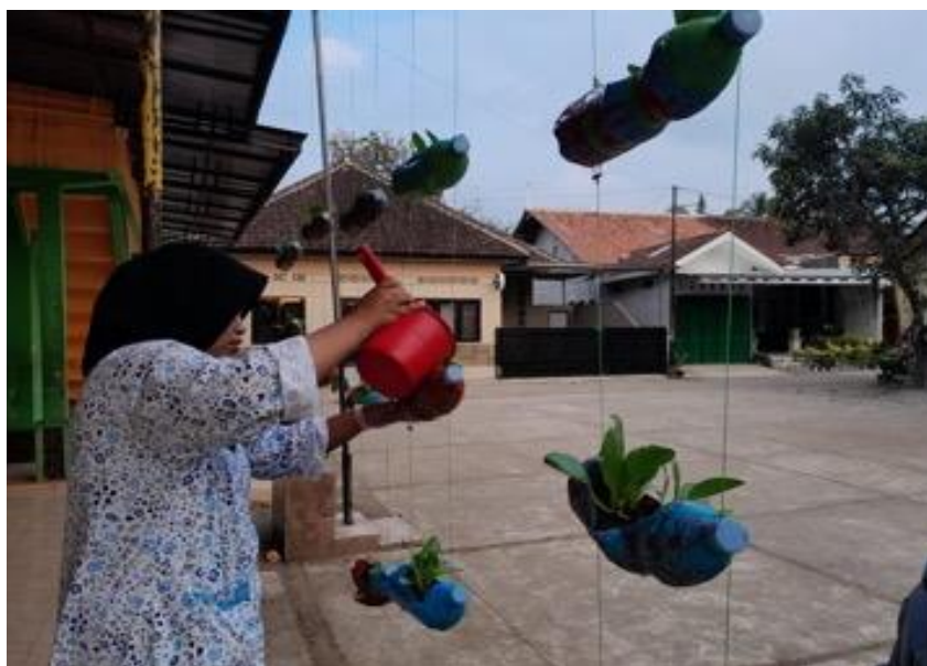
Gambar 9. Monitoring