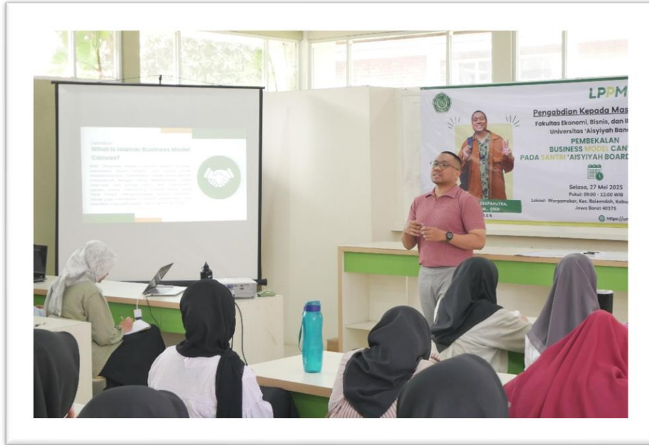
Gambar 3. Kegiatan Penyuluhan Wirausaha Islami