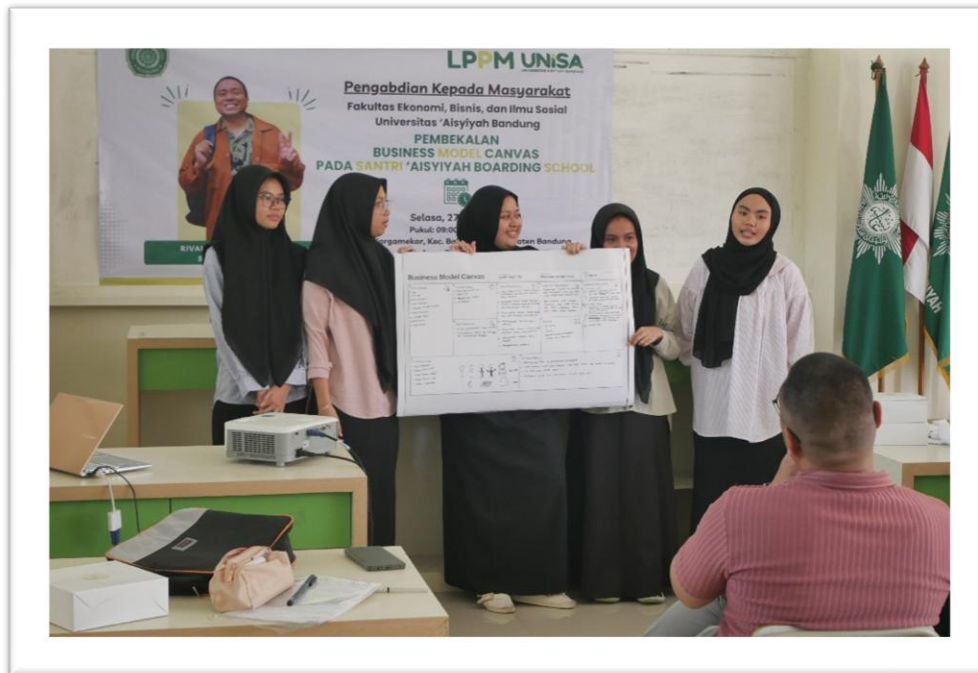
Gambar 4. Kegiatan presntasi Business Model Canvas