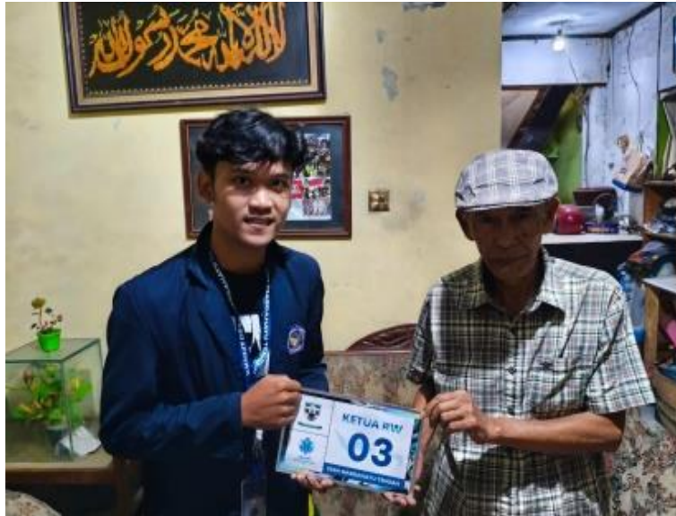
Gambar 4. Pembuatan plakat papan nama pengurus RT/RW