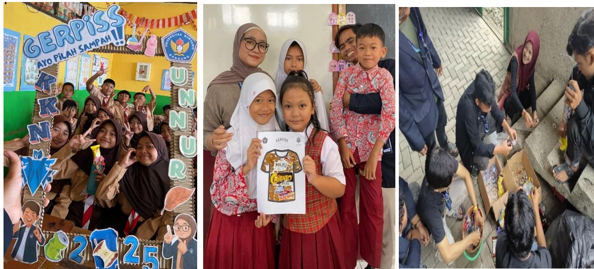
Gambar 3. Dari Kiri ke Kanan: Gerakan GERPISS, dan Pembuatan Ecobrik

masyarakat untuk mulai membiasakan diri memilah sampah. Ditambah dengan papan infografis yang berisi panduan visual, warga lebih mudah memahami dan menerapkan kebiasaan baru ini. Meskipun partisipasi tidak merata di seluruh rumah tangga, adanya kelompok warga yang sudah mempraktikkan pemilahan menjadi indikator awal terbentuknya budaya peduli lingkungan di desa.