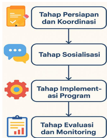
Gambar 2. Tahapan kegiatan

Dengan metode pelaksanaan ini, program KKN-MT tidak hanya memberikan solusi teknis, tetapi juga menekankan pentingnya partisipasi masyarakat, transparansi, serta keberlanjutan.