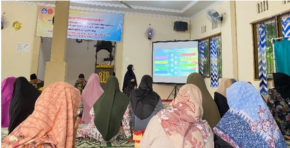
Gambar 3. Proses penyerapan materi FBE kepada masyarakat Desa

Kehadiran media digital berupa modul dan video juga relevan dengan tren digital parenting support yang memudahkan monitoring dan komunikasi jarak jauh, sebagaimana diuraikan Sisbintari & Setiawati (2021). Dengan demikian, hasil pengabdian ini tidak hanya memberikan dampak langsung berupa peningkatan pengetahuan, tetapi juga membangun ekosistem pendidikan keluarga yang berorientasi pada keberlanjutan (Maulana et al., 2025).