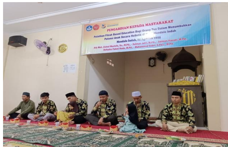
Gambar 2. Pelatihan FBE

Hasil pengabdian ini mengonfirmasi bahwa program pelatihan berbasis fitrah mampu meningkatkan kapasitas orang tua dalam menjalankan perannya sebagai pendidik pertama dan utama di rumah. Peningkatan pemahaman peserta sejalan dengan penelitian Rizqi (2020) yang menegaskan bahwa FBE dapat menjadi paradigma baru pendidikan keluarga yang integratif. Penerapan aktivitas harian berbasis fitrah terbukti membantu anak mengembangkan kemandirian, konsentrasi, dan keterampilan sosial, sebagaimana ditegaskan dalam studi Montessori oleh Lillard (2017). Lebih jauh, kemampuan orang tua dalam memetakan potensi anak menunjukkan bahwa asesmen sederhana berbasis fitrah dapat menjadi instrumen efektif untuk mendukung tumbuh kembang anak sesuai bakat dan keunikan masing-masing.