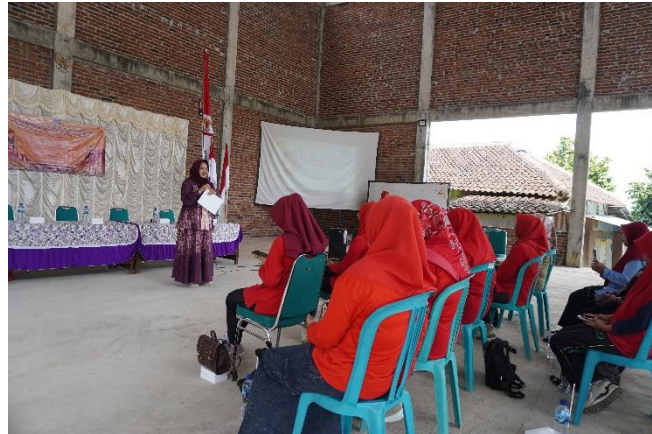
Gambar 3. Pemberian materi

dasar seperti melangkah, mengayun, berputar, dan melompat yang dikemas secara sederhana agar mudah dipraktikkan. Guru PAUD diberi kesempatan menirukan sekaligus mengeksplorasi gerak tersebut dengan improvisasi. Selanjutnya, peserta mengulang gerak yang sudah dipelajarinya. Hasil pelatihan memperlihatkan bahwa sebagian besar guru lebih percaya diri untuk mencoba gerakan baru, bahkan mengkombinasikan gerakan yang diperkenalkan.