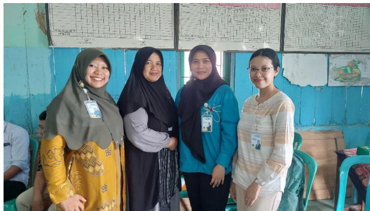
Gambar 2. Observasi

Tahap persiapan dilakukan untuk memastikan kegiatan pengabdian berjalan dengan baik dan sesuai kebutuhan mitra. Tim pengabdian terlebih dahulu melakukan observasi ke satuan PAUD di Desa Sambirejo. Observasi ini bertujuan untuk mengidentifikasi permasalahan yang dihadapi guru terkait pembelajaran seni tari. Hasil identifikasi menunjukkan adanya tiga permasalahan utama, yaitu: (1) keterbatasan pemahaman guru terkait konsep pembelajaran tari anak usia dini, (2) kurangnya keterampilan praktik tari, dan (3) rendahnya kepercayaan diri guru dalam mengajar tari di kelas. Persiapan berikutnya adalah penyediaan materi dan media. Media pendukung yang disiapkan berupa musik tari anak, properti pita sederhana yang aman digunakan anak untuk menari, serta alat bantu presentasi. Tahap persiapan ini menjadi landasan penting agar pelaksanaan dapat berjalan efektif.