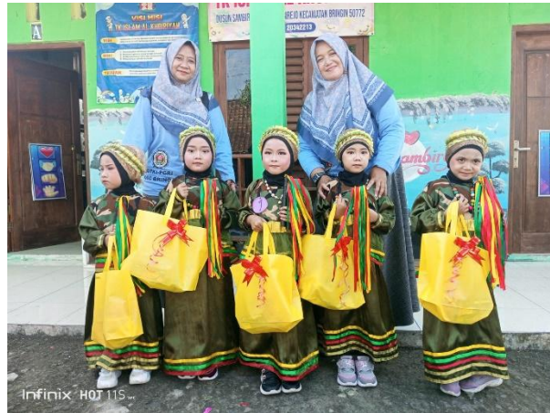
Gambar 5. Guru dan siswa PAUD Desa Sambirejo

Dampak positif dari kegiatan pengabdian ini tidak hanya dirasakan oleh guru, tetapi juga oleh peserta didik di PAUD. Salah satu guru mitra melaporkan bahwa siswanya mengikuti lomba tari tingkat kecamatan dengan membawakan karya tari hasil dari pelatihan. Siswa tersebut berhasil meraih Juara 1, sebuah capaian yang menjadi bukti nyata keberhasilan program.