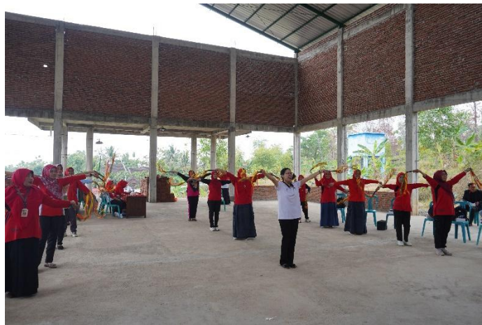
Gambar 4. Pendampingan praktik

Evaluasi pengetahuan dilakukan dengan memberikan beberapa pertanyaan. Hasilnya menunjukkan peningkatan skor rata-rata peserta, yang mengindikasikan bertambahnya pemahaman guru terhadap konsep dasar pembelajaran tari, fungsi tari bagi perkembangan anak, serta strategi integrasi budaya lokal. Sementara itu, evaluasi keterampilan dilakukan melalui praktik langsung. Guru diminta memperagakan kembali gerakan tari yang telah dipelajari. Hasil observasi menunjukkan bahwa sebagian besar guru mampu menampilkan gerakan dengan baik, meskipun masih ada beberapa yang perlu perbaikan dalam penguasaan irama.