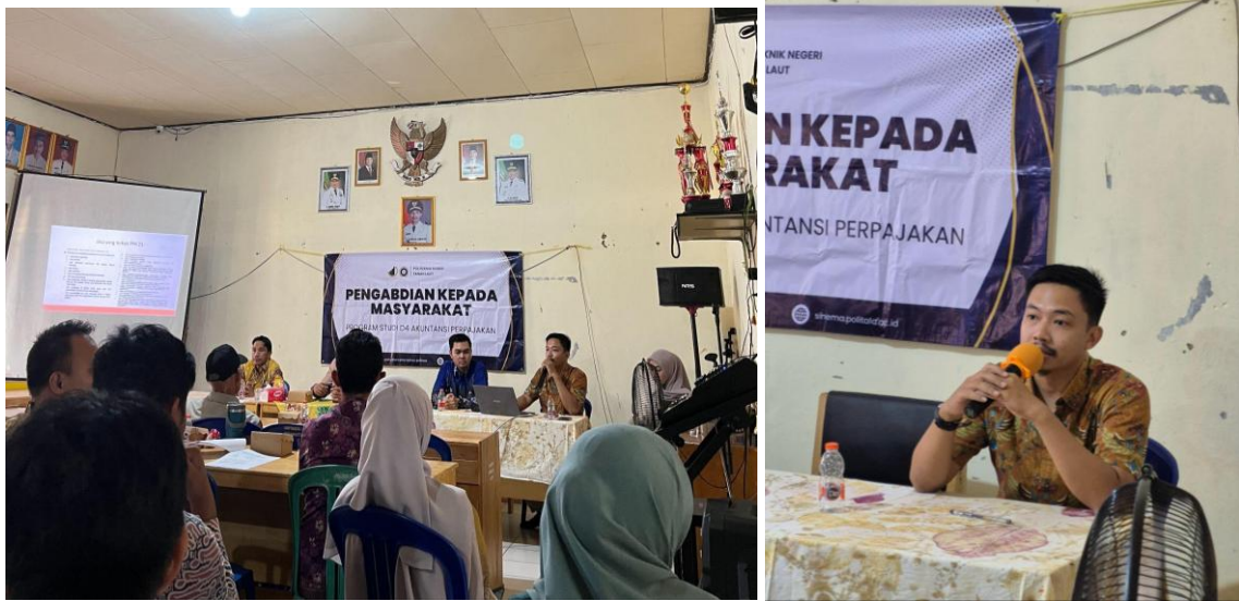
Gambar 5. Kegiatan asistensi Sistem Inti Aplikasi Perpajakan (Coretax) Terkait Pemotongan dan Pemungutan PPh 23