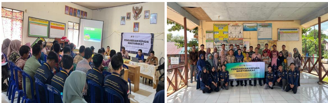
Gambar 7. Dokumentasi kegiatan bersama peserta dan tim pengabdian kepada masyarakat

Dengan adanya diskusi ini, maka peserta diarahkan untuk mampu menganalisis jenis transaksi dan mengaplikasikannya pada coretax sehingga meminimalkan kesalahan dalam pemotongan dan pemungutan PPh 23 di Desa Pemuda. Secara teoritis, pendampingan melalui kegiatan asistensi ini dapat menjadi media pembelajaran sosial yang baik dalam rangka meningkatkan pengetahuan, keterampilan dan skill aparatur desa Pemuda KNPI. Hal ini juga sejalan dengan penelitian Devita & Ismail, (2025). Hasil tersebut menunjukkan bahwa pelatihan coretax memberikan dampak positif terhadap peningkatan kapasitas administrasi perpajakan perangkat desa. Metode pelatihan berbasis praktik langsung yang diterapkan menunjukkan peningkatan yang sangat efektif untuk mempercepat pemahaman aparatur desa.