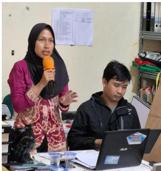
Gambar 6. Peserta mengajukan pertanyaan

Berdasarkan diskusi dengan peserta kegiatan asistensi, maka salah satu kendala mendasar adalah aparatur desa belum mampu mengidentifikasi secara tepat jenis transaksi yang menjadi objek pemotongan PPh 21 atau PPh 23. Dalam praktiknya, aparatur sering kali mengalami kebingungan ketika berhadapan