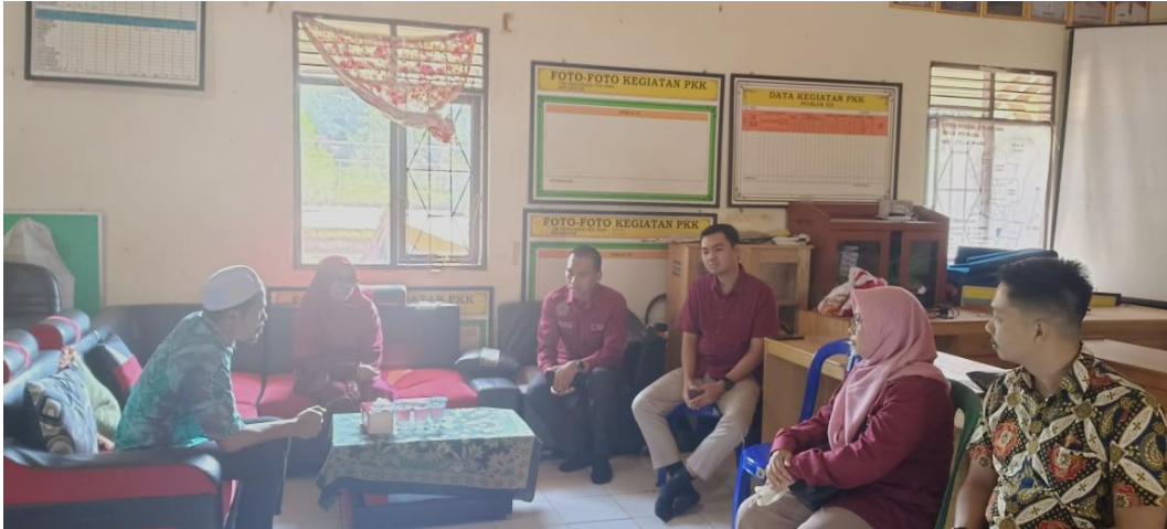
Gambar 2. Kegiatan koordinasi dengan aparat desa sebelum dilaksanakan kegiatan asistensi Sistem Inti Aplikasi Perpajakan (Coretax) Terkait Pemotongan dan Pemungutan PPh 23

Berdasarkan informasi dari sekretaris desa, maka didapat permasalahan ini terkait dengan kurangnya pemahaman aparatur desa terhadap ketentuan perpajakan, khususnya PPh Pasal 23, serta keterbatasan kemampuan dalam mengoperasikan aplikasi Coretax secara optimal. Permasalahan ini muncul karena selama ini pelaksanaan kewajiban pemotongan pajak atas transaksi jasa di lingkungan desa masih dilakukan secara konvensional tanpa acuan yang memadai terhadap peraturan perpajakan terbaru.