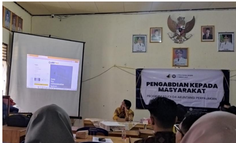
Gambar 4. Tampilan simulasi sederhana pembuatan bukti potong elektronik