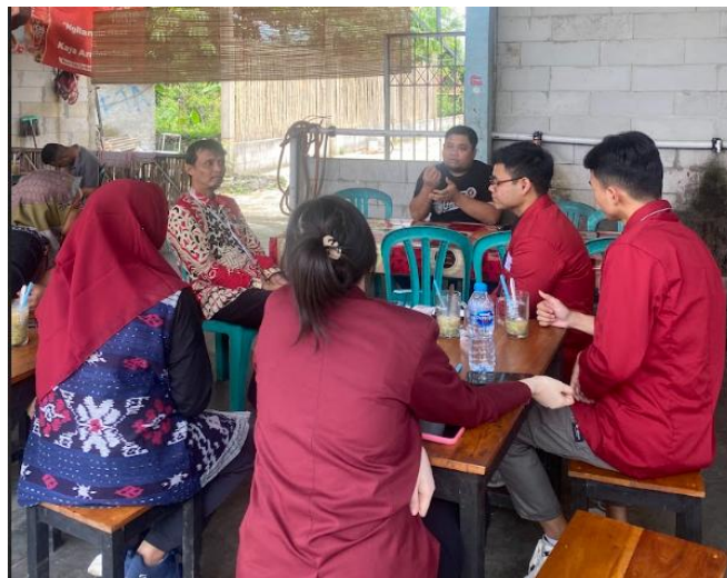
Gambar 3. Pendampingan penyusunan SOP

Pendampingan pembuatan dokumen Standar Operasional Prosedur (SOP) dan Business Model Canvas (BMC) pada Paguyuban Dawet Ayu Banjarnegara dilakukan melalui sesi diskusi. Pembuatan dokumen SOP meliputi setiap tahap produksi, yaitu penerimaan bahan baku, pemasakan dodol dawet, pembuatan larutan gula, dan pembuatan larutan santan (Dewita et al , 2025). SOP ini disusun untuk memastikan kualitas dan keamanan produk dengan mengatur standar operasional serta pengendalian titik kritis seperti suhu dan waktu pada setiap proses, sehingga dapat menghasilkan produk dawet ayu yang konsisten dan aman bagi konsumen. Sedangkan dokumen BMC disusun untuk produk yang sedang dikembangkan, yaitu produk dawet ayu siap minum. Produk ini merupakan salah satu pengembangan produk baru untuk minuman dawet yang kekinian yang formulanya masih dilakukan proses pengembangan, sehingga belum dipasarkan secara luas.