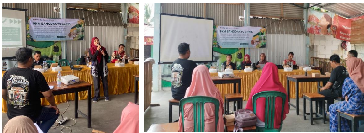
Gambar 2. Kegiatan Penyuluhan CPPOB dan SOP

Penyuluhan ini bertujuan untuk memberikan pemahaman kepada pengurus dan anggota mengenai pentingnya keamanan pangan CPPOB dalam produksi dawet ayu, termasuk bagaimana menjaga kebersihan selama proses produksi, pengendalian titik-titik kritis, serta penerapan dokuem SOP pada setiap proses produksi (Kurniawati et al , 2023). Dengan pemahaman ini, diharapkan anggota dapat memastikan produk yang dihasilkan aman untuk dikonsumsi dan memenuhi standar mutu yang telah ditetapkan.