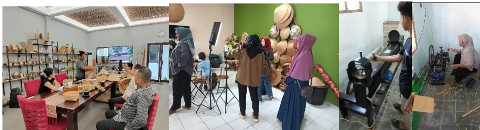
Gambar 2. Studi ke esportir PT.HMI, praktik digitalisasi pemasaran, penggunaan teknologi tepat guna dalam proses produksi yang efisien

Dampak Sosial Ekonomi kegiatan pemberdayaan ini adalah terbangunnya budaya belajar dan adaptasi teknologi di kalangan pelaku UMKM, meningkatnya motivasi generasi muda desa untuk ikut terlibat dalam pengembangan produk unggulan, munculnya semangat kolaborasi antar-UMKM dalam memperluas jaringan pemasaran.