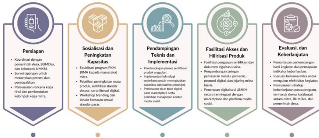
Gambar 1. Tahapan Pelaksanaan Kegiatan PKM