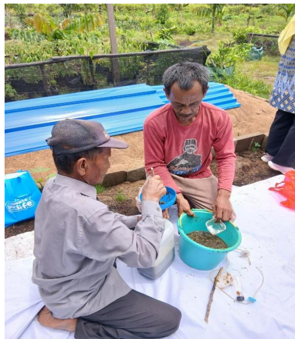
Gambar 2. Proses Pembuatan POC

Selain peningkatan kapasitas individu, kegiatan ini juga mendorong terbentuknya kelompok swadaya lingkungan di tingkat RT, yang secara mandiri memproduksi dan mengemas POC dalam botol 500 mL. Kegiatan ini menjadi langkah awal menuju ekonomi sirkular desa, di mana limbah diolah menjadi produk bernilai ekonomi. Hal ini sejalan dengan studi (Aryani et al., 2024) yang menekankan pentingnya pengelolaan limbah organik sebagai bentuk investasi sosial yang berkelanjutan dan bernilai ekonomi tinggi. Berikut merupakan proses pembuatan POC oleh kelompok Tani Alam Berkah: