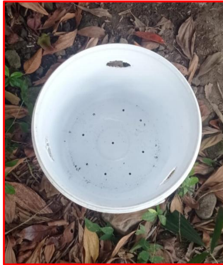
Gambar 4. Tidak ada kumbang tanduk yang masuk ke dalam ember Ferotrap

Hal ini menunjukkan bahwa walaupun ada kumbang tanduk di padukuhan sebelah tetapi kumbang tersebut belum sampai di kebun aren milik KTH Ngudi Lestari. Hal ini dikarenakan jarak antar lokasi sekitar 1 km dan di antara kedua lokasi terdapat banyak rumah warga dan tanaman selain tanaman aren. Fenomena tidak tertangkapnya kumbang dalam perangkap feromon dapat dijelaskan melalui beberapa faktor yang mempengaruhi efektivitas perangkap feromon, yaitu keterbatasan jangkauan feromon, kepadatan populasi rendah, ketersediaan tempat berkembang biak, dan jarak dispersal kumbang tanduk.