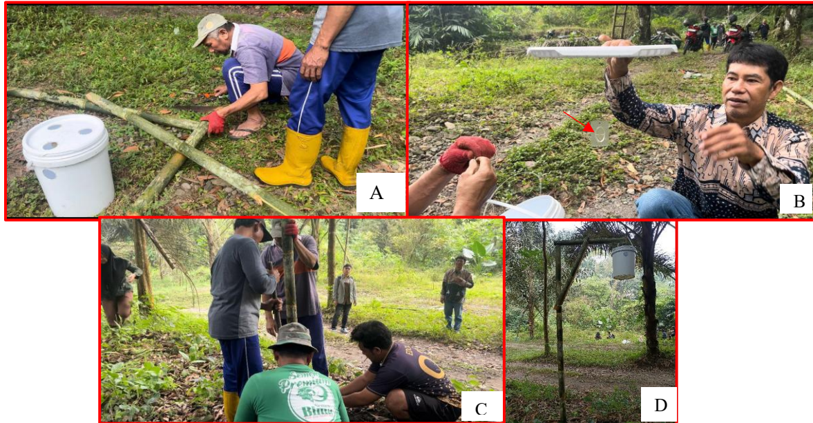
Gambar 3. Kegiatan pembuatan perangkat Ferotrap. Keterangan: A. Pemotongan dan perakitan tiang batang bambu; B. Pemasangan feromon pada tutup ember; C. Tiang bambu didirikan; D. Tampak samping perangkat ferotrap

penyuluhan menjadi lebih paham. Demikian juga tentang cara pembuatan perangkat Ferotrap dan cara pengamatan kumbang tanduk, anggota kelompok tani lebih paham. Apalagi ketika praktik pembuatan dan pemasangan perangkat Ferotrap, anggota kelompok tani dengan antusias mengikuti kegiatan dari awal sampai akhir. Pembuatan perangkat kumbang tanduk yaitu Ferotrap telah berhasil dipahami dan dipraktikkan oleh anggota KTH Ngudi Lestari. Hasil kegiatan pembuatan Ferotrap yang dibuat dapat dilihat pada Gambar 3.