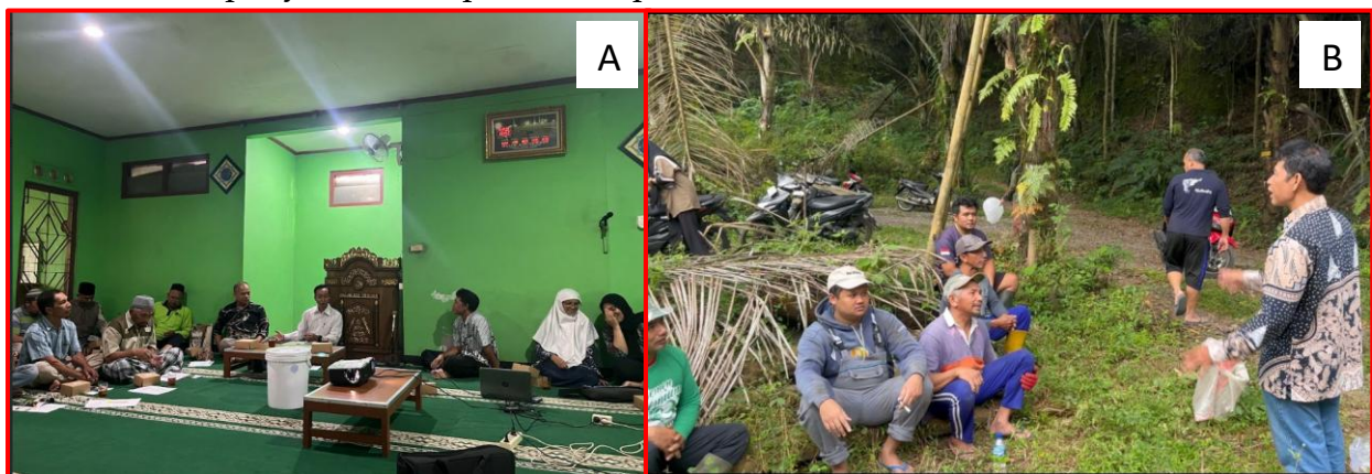
Gambar 2. Sosialisasi kegiatan TIM PKM Instiper Yogyakarta. Keterangan: A. Penyuluhan di dalam ruang, B. Penyuluhan di kebun tanaman aren

Penyuluhan kepada anggota KTH Ngudi Lestari dilakukan dua kali yaitu pada awal sosialisasi kegiatan TIM PKM Instiper Yogyakarta dan di kebun tanaman aren. Dokumentasi penyuluhan dapat dilihat pada Gambar 2.