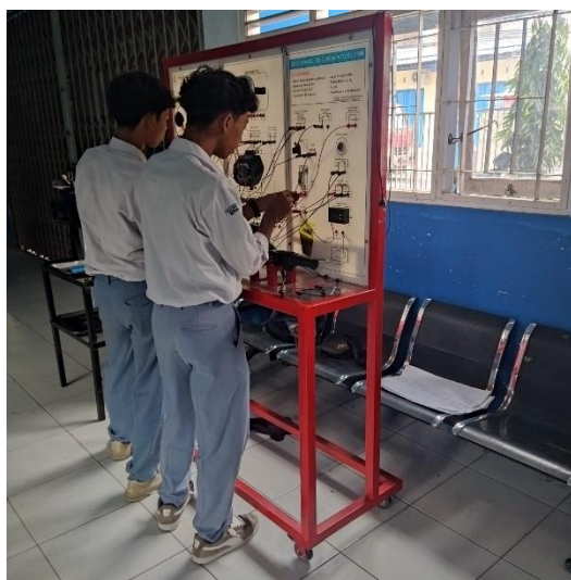
Gambar 3. Praktek Merangkai Trainer Sepeda Motor Listrik