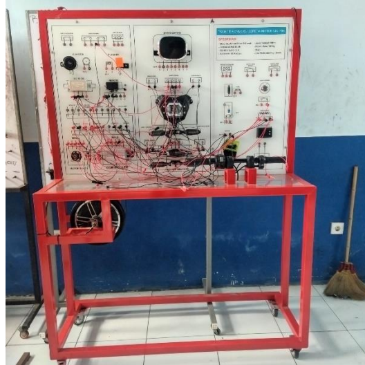
Gambar 2. Trainer Sepeda Motor Listrik

Tahap perancangan kegiatan dilakukan dengan menyusun modul pelatihan yang mencakup konsep dasar kendaraan listrik, pengenalan komponen, serta prosedur perawatan sederhana. Modul tersebut dirancang berdasarkan hasil temuan pada tahap identifikasi sebelumnya agar sesuai dengan kebutuhan peserta. Selanjutnya, tim pengabdian menyiapkan perangkat praktik sebagai media pembelajaran langsung bagi peserta didik. Media pembelajaran trainer sepeda motor listrik disajikan pada Gambar 2,