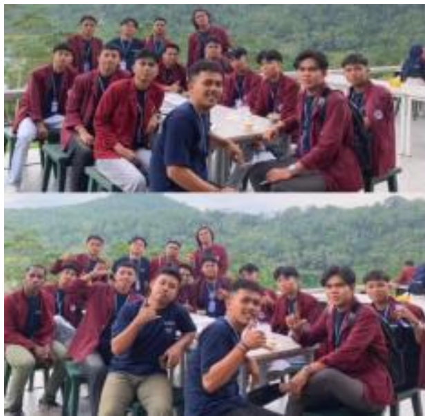
Gambar 4. Mahasiswa berdiskusi terkait hasil pengamatan

Pengalaman ini memperkuat pemahaman mahasiswa bahwa pengembangan wisata tidak hanya melibatkan aspek fisik destinasi, tetapi juga melibatkan dinamika sosial, nilai budaya, dan struktur ekonomi masyarakat local. Keterlibatan mahasiswa dalam kegiatan pengabdian menjadi jembatan antara teori yang dipelajari di kampus dan kondisi yang mereka temui di lapangan. Melalui pengalaman ini, mahasiswa berkesempatan mengembangkan kemampuan berpikir kritis, memecahkan masalah, serta berkomunikasi dengan berbagai kelompok social. Hal ini merupakan keterampilan yang sangat dibutuhkan untuk mendorong pembangunan yang bertumpu pada potensi lokal (Fadhillah et al., 2024; Sentanu & Mahadiansar, 2020).