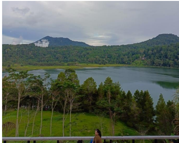
Gambar 5. Pemandangan danau linow

teoretis, tetapi merupakan upaya nyata yang membutuhkan perhatian terhadap aspek lingkungan, budaya, dan masyarakat.