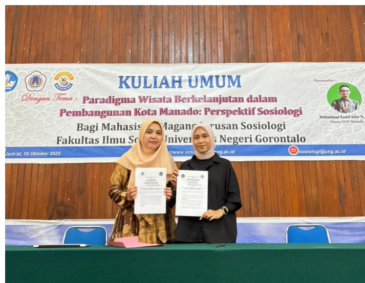
Gambar 6. Penandatanganan kerja sama antara ketua program studi sosiologi agama IAIN Manado dengan ketua program studi sosiologi UNG

Secara umum, hasil kegiatan menunjukkan bahwa tujuan program telah tercapai. Mahasiswa memperoleh peningkatan kapasitas teoretis melalui kuliah pakar, kemampuan analitis melalui diskusi dan studi kasus, serta pengalaman empiris melalui observasi langsung di Danau Linow. Manfaat program juga tercapai melalui tumbuhnya kesadaran ekologis, kemampuan membaca dinamika masyarakat, dan pemahaman tentang peran budaya dalam pariwisata. Luaran berupa peningkatan jejaring akademik dan refleksi mahasiswa yang menggambarkan pemahaman konseptual yang lebih matang juga memperkuat keberhasilan kegiatan ini. Dengan demikian, kegiatan pengabdian ini tidak hanya memberikan dampak jangka pendek dalam bentuk pembelajaran mahasiswa, tetapi juga membuka peluang pengembangan program lanjutan untuk memperkuat kapasitas keilmuan dan pengalaman praktis mahasiswa Sosiologi UNG dalam isu pariwisata berkelanjutan