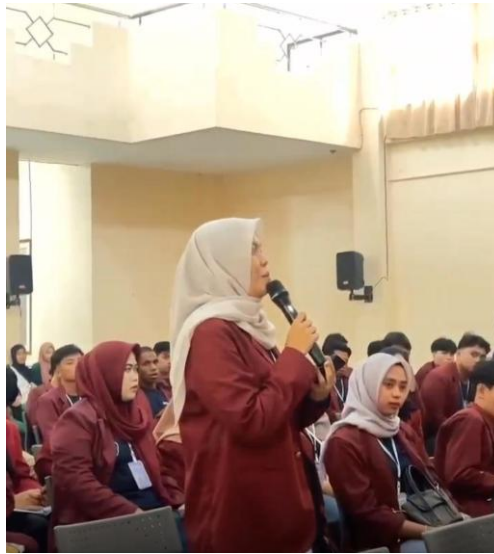
Gambar 3. Mahasiswa aktif bertanya pada narasumber

Partisipasi mahasiswa selama sesi diskusi berlangsung juga menunjukkan tercapainya luaran berupa peningkatan kemampuan analitis. Pertanyaan mahasiswa mengenai isu Pasar Ekstrem Tomohon, komersialisasi budaya Minahasa, dan dampak kepariwisataan terhadap relasi sosial memperlihatkan bahwa mereka mampu menerapkan kerangka konseptual sosiologi untuk membaca fenomena empiris. Keterlibatan aktif ini merupakan indikator bahwa tujuan kegiatan untuk memperkaya kapasitas teoretis mahasiswa telah terpenuhi.