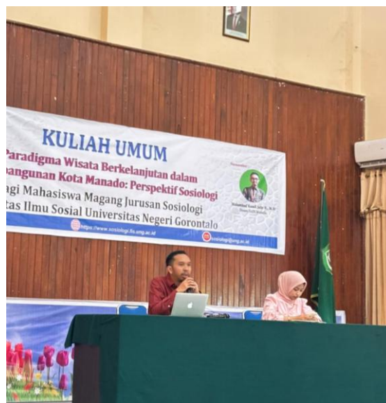
Gambar 2. Pelaksanaan Kuliah Umum

Kuliah pakar memberikan kontribusi terhadap pemahaman mahasiswa tentang struktur sosial dan budaya yang melandasi pengembangan wisata berkelanjutan. Konsep CBT dijelaskan sebagai pendekatan pemberdayaan komunitas yang menempatkan masyarakat lokal sebagai aktor utama dalam pengelolaan destinasi. Selain itu, penjelasan mengenai objek pemajuan kebudayaan serta pilar pelestarian budaya memperluas wawasan mahasiswa tentang bagaimana kebijakan kebudayaan dapat terintegrasi dengan sektor pariwisata.