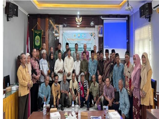
Gambar 8. Tim PKM bersama Tim Mitra