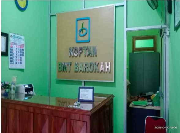
Gambar 2. Ruang Pelayanan Koptan BMT Barokah