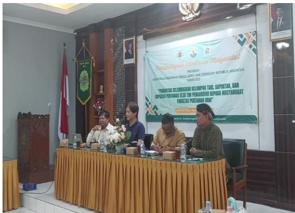
Gambar 5. Penyuluhan Program PKM

Sebelum kegiatan penyuluhan, peserta diminta untuk mengisi kuesioner yang sudah disiapkan sebelumnya oleh tim PKM. Tujuan pengisian kuesioner ini untuk mengukur dampak dari program PKM dengan membandingkan sebelum dan setelah pelaksanaan. Pada saat dilaksanakan penyuluhan, peserta terlihat antusias dan terlibat aktif dalam diskusi dan penyusunan rencana aksi. Mitra menyadari bahwa dengan bersinergi, mereka dapat mencapai skala ekonomi yang lebih besar dan memiliki daya saing yang lebih tinggi. Kegiatan penyuluhan diselenggarakan pada tanggal 18 September 2025 dengan menempati kantor kelurahan desa setempat. Kegiatan penyuluhan mendapatkan respon yang sangat positif dari peserta PKM. Terlihat antusiasme tinggi dan komitmen kuat untuk melakukan konsolidasi. Pelaksanaan diskusi berjalan interaktif dan mitra mulai menyadari manfaat bekerja secara kolektif. Tahap ini menjadi fondasi yang kokoh untuk implementasi pada tahap selanjutnya.