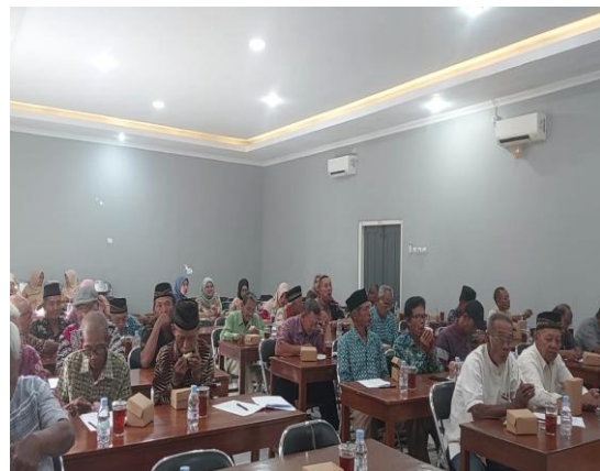
Gambar 6. Peserta Penyuluhan