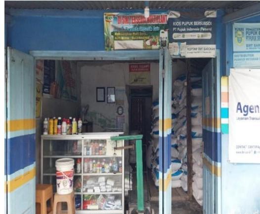
Gambar 3. Kios Saprodi Koptan BMT Barokah