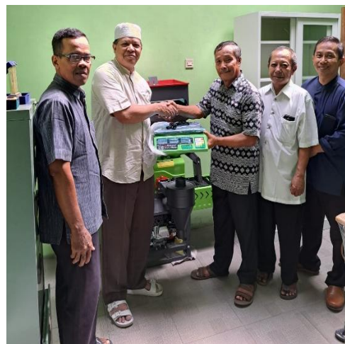
Gambar 9. Pelatihan Teknologi ke Koperasi BMT Barokah