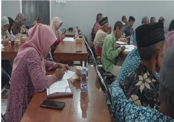
Gambar 7. Pengisian Kuesioner