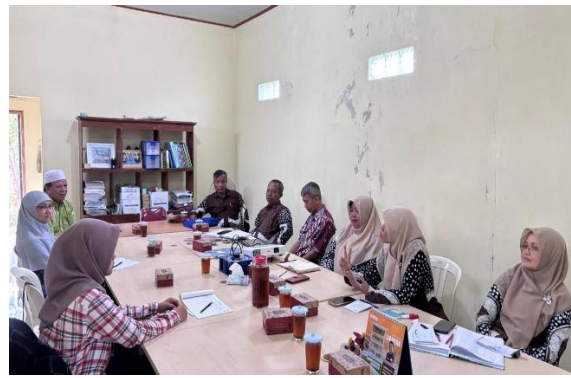
Gambar 4. Sosialisasi Program dengan Mitra