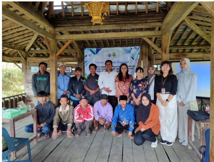
Gambar 2. Dokumentasi Kegiatan Pelatihan Pengembangan Paket Wisata

Pelaksanaan kegiatan pelatihan pengembangan paket wisata dan penyusunan material promosi paket wisata diikuti oleh 20 peserta yang terdiri dari pokdarwis, perangkat desa, dan pengelola destinasi wisata Bukit Grenden. Kegiatan pelatihan dimulai dengan sambutan dari Ketua PKM dan Sekretaris Desa Pogalan. Selanjutnya, peserta diminta mengisi lembar pre-test untuk mengetahui pengetahuan peserta terkait dengan pengembangan paket wisata outbound dilanjutkan dengan pemaparan materi terkait pengembangan paket wisata outbound. Dokumentasi kegiatan pelatihan dapat dilihat pada Gambar 1.