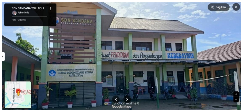
Gambar 2. SDN Sandana