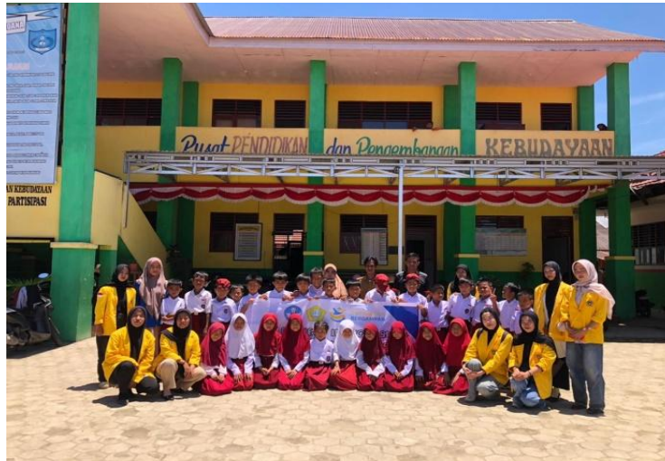
Gambar 7. Foto bersama guru dan siswa SDN SANDANA

Urgensi tersebut diperkuat oleh penelitian (Melindawati et al., 2024) yang menjelaskan bahwa pendidikan Pancasila di sekolah dasar merupakan fondasi penting untuk menanamkan nilai keberagaman, toleransi, dan gotong royong dalam kehidupan sehari-hari peserta didik. Hal ini sejalan dengan konsep Kurikulum Merdeka yang mengintegrasikan nilai-nilai Profil Pelajar Pancasila sebagai orientasi pembelajaran. Sebagaimana dijelaskan (Awaliya & Utami, 2024) keenam dimensi Profil Pelajar Pancasila termasuk gotong royong, kebinekaan global, dan religiusitas membentuk kerangka karakter yang harus dikembangkan pada peserta didik. Di antara dimensi tersebut, gotong royong memiliki peran fundamental karena mencerminkan nilai kebersamaan, solidaritas, dan kolaborasi yang menjadi warisan budaya Indonesia. Dalam pembelajaran, nilai ini diwujudkan melalui aktivitas kerja kelompok, saling mendukung, serta menciptakan lingkungan inklusif bagi semua siswa.