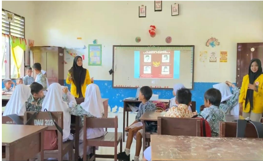
Gambar 4. Proses penyampaian materi

Dari hasil pengumpulan data, diketahui bahwa 5 orang siswa mampu mengidentifikasi dan menjelaskan makna toleransi dengan baik, ditunjukkan dengan sikap menghargai perbedaan pendapat dan penerimaan terhadap keragaman teman sekelas. Sementara itu, 16 siswa berhasil menunjukkan pemahaman terhadap nilai gotong royong melalui tindakan nyata seperti membantu teman yang kesulitan, membersihkan kelas bersama serta bekerja sama dalam kegiatan sosial sekolah.