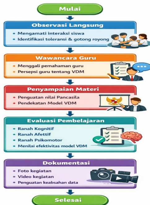
Gambar 3. Alur kegiatan