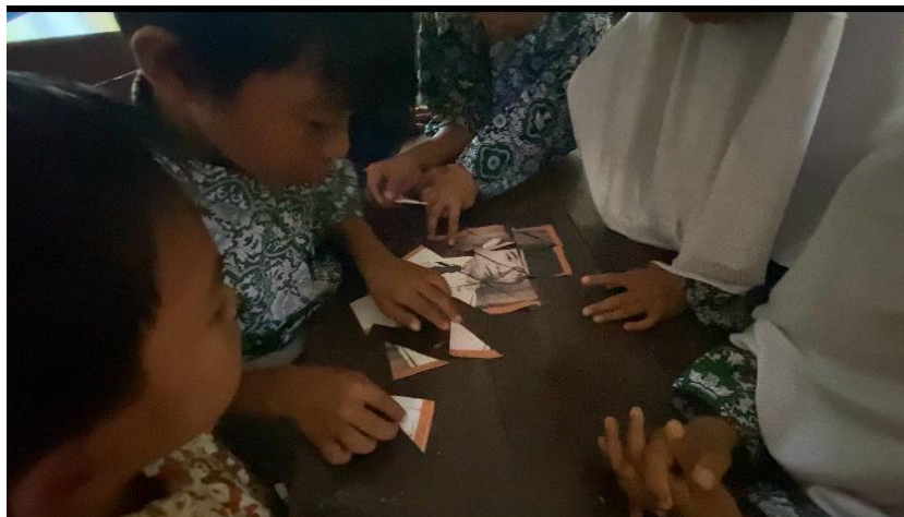
Gambar 6. Pengerjaan tugas kelompok

Hasil kegiatan pengabdian ini menunjukkan bahwa penerapan Value Detection Model (VDM) dalam pembelajaran Pendidikan Pancasila memberikan kontribusi signifikan terhadap peningkatan keterlibatan dan pemahaman siswa terhadap nilai-nilai Pancasila, khususnya toleransi dan gotong royong. Melalui model ini, peserta didik mengikuti proses belajar secara aktif, reflektif, dan kolaboratif sehingga mereka tidak hanya menerima materi secara pasif, tetapi juga berperan langsung dalam membangun makna nilai berdasarkan pengalaman personal mereka. Temuan ini sejalan dengan pandangan (Wantari & Rati, 2022) yang menegaskan bahwa efektivitas pendidikan nilai sangat dipengaruhi oleh keterlibatan penuh peserta didik dalam proses identifikasi dan internalisasi nilai sosial melalui kegiatan diskusi, analisis kasus nyata, dan refleksi yang mendorong pemahaman nilai secara mendalam serta kontekstual.