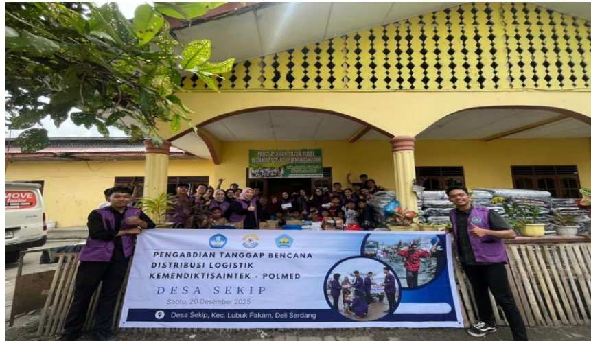
Gambar 5. Pendistribusian Logistik Kepada Panti Asuhan Putra Putri Yayasan Amal Sosial Al-Jamiyatul Wasliyah