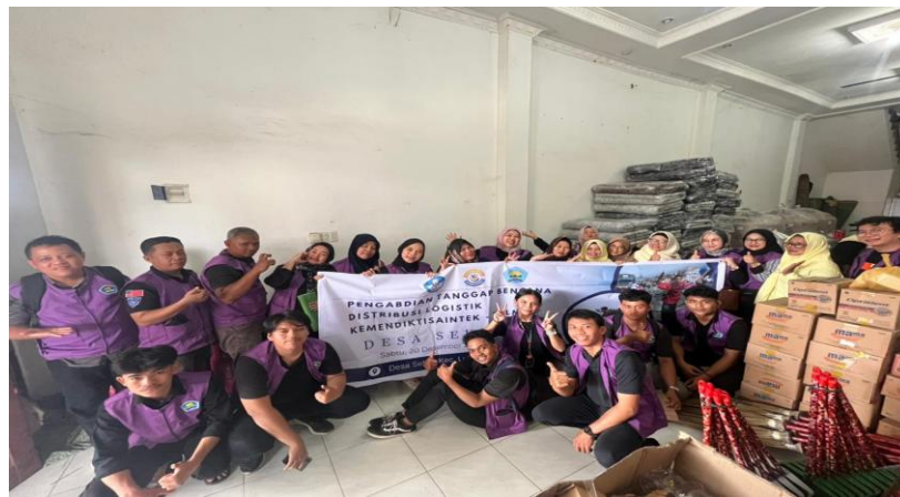
Gambar 4. Pendistribusian Logistik Kepada UMKM Dibawah Naungan Himpunan Wanita Karya (HWK) Deli Serdang

Pemberian bantuan logistik kepada UMKM Wanita yang tersebar di beberapa Kecamatan yang ada di Kabupaten Deli Serdang akan memberikan sebuah kekuatan untuk menghadapi situasi bencana yang telah terjadi di akhir November 2025. Bantuan logistik juga dapat memberikan modal awal bagi pelaku UMKM untuk dapat meneruskan kembali usahanya yang telah terdampak banjir dan longsor. Distribusi logistik ini menjadi salah satu langkah awal yang tentunya akan diteruskan ke langkah pemulihan ekonomi berikutnya.