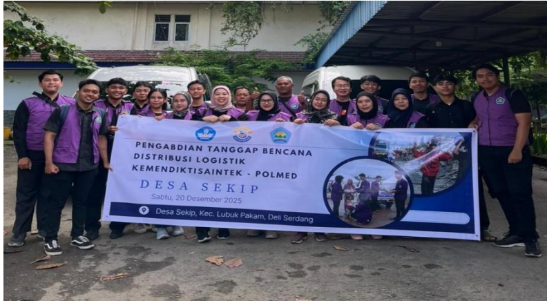
Gambar 3. Tim Relawan Tanggap Bencana Kemendiktisaintek-Polmed

Pemberian bantuan logistik kepada UMKM Wanita yang tersebar di beberapa Kecamatan yang ada di Kabupaten Deli Serdang akan memberikan sebuah kekuatan untuk menghadapi situasi bencana yang telah terjadi di akhir November 2025. Bantuan logistik juga dapat memberikan modal awal bagi pelaku UMKM untuk dapat meneruskan kembali usahanya yang telah terdampak banjir dan longsor. Distribusi logistik ini menjadi salah satu langkah awal yang tentunya akan diteruskan ke langkah pemulihan ekonomi berikutnya.