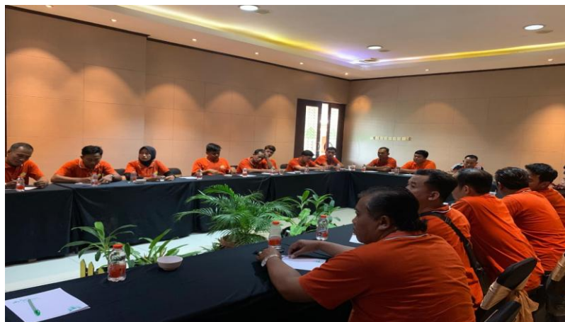
Gambar 3. Peserta kegiatan strategi anti fraud

di lembaga keuangan mikro mampu mengurangi risiko fraud secara signifikan. Secara keseluruhan, kegiatan pengabdian masyarakat berhasil meningkatkan kesadaran, sikap, dan perilaku anti-fraud karyawan BPR di Blitar. Proses ini tidak hanya memberikan pemahaman teoretis, tetapi juga kemampuan praktis untuk mencegah terjadinya kecurangan dalam aktivitas sehari-hari. Hasil pengabdian menunjukkan bahwa kombinasi penyuluhan, simulasi kasus, workshop, dan diskusi partisipatif merupakan strategi yang efektif untuk membangun budaya anti-fraud di lembaga keuangan skala mikro. Pembahasan ini menegaskan bahwa penguatan budaya anti-fraud harus dilakukan secara berkelanjutan dan melibatkan seluruh lapisan karyawan, bukan hanya manajemen. Dengan demikian, implementasi budaya anti-fraud menjadi bagian dari perilaku kerja sehari-hari, mendukung tata kelola yang transparan, akuntabel, dan meningkatkan kepercayaan masyarakat terhadap BPR. Dokumen pelaksanaan dapat dilihat sebagai berikut;