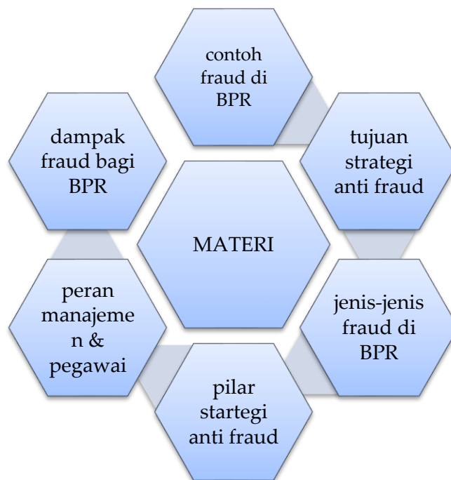
Gambar 2. Diagram Materi

Penjelasannya tentang Fraud atau kecurangan merupakan tindakan sengaja untuk memperoleh keuntungan pribadi atau kelompok dengan melanggar hukum, aturan, atau etika, yang dipengaruhi oleh tekanan, kesempatan, dan rasionalisasi ( fraud triangle ), serta berbeda dengan kesalahan ( error ) yang tidak disengaja maupun pelanggaran etika yang tidak selalu menimbulkan kerugian finansial. (Aksa, A. F. (2018). Jurnal Ekonomi, Bisnis, Dan Akuntansi (JEBA) , 20(4), 1-17.) Dalam perbankan, khususnya BPR, fraud dapat terjadi dalam bentuk fraud internal, fraud eksternal, maupun fraud kolusi, dengan contoh penggelapan dana, manipulasi laporan keuangan, penyalahgunaan wewenang, dan pemalsuan dokumen kredit yang berdampak pada kerugian finansial, penurunan reputasi, serta risiko hukum bagi lembaga. Oleh karena itu, karyawan BPR harus memiliki pemahaman yang kuat dan