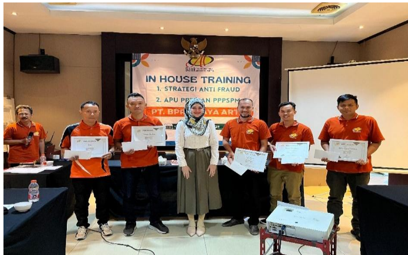
Gambar 4. Peserta kegiatan

pengendalian internal guna mencegah terjadinya tindak kecurangan di lingkungan perbankan.