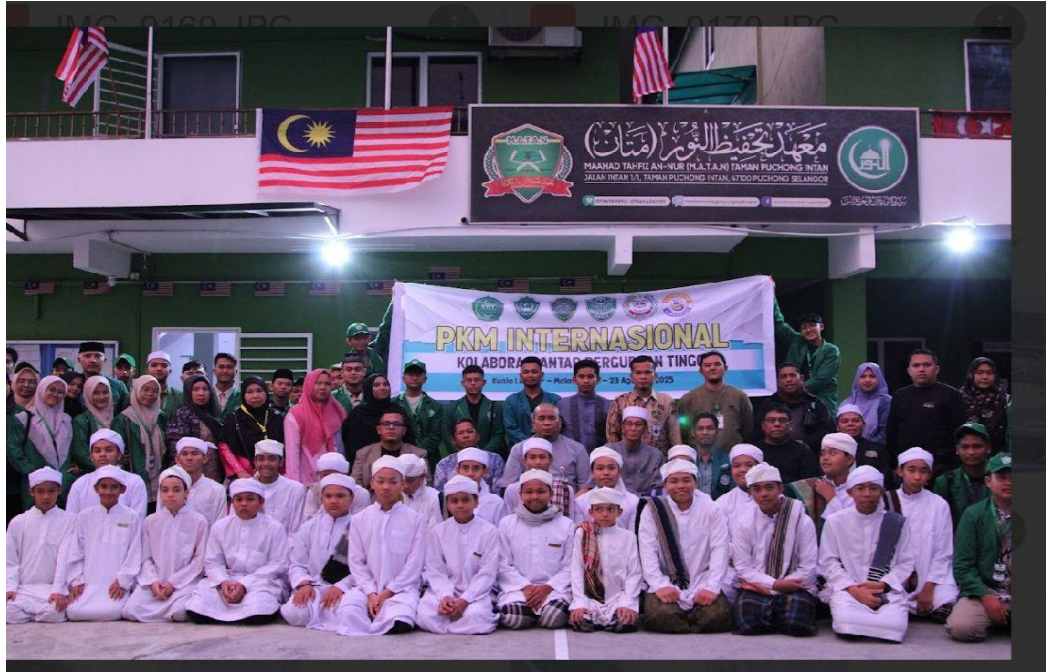
Gambar 4. Foto Bersama Dengan Peserta PKM