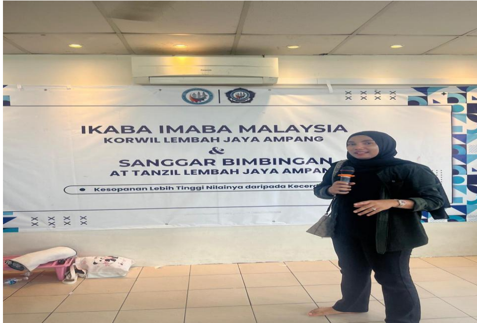
Gambar 2. Gambar Penyampaian PKM.

Kegiatan PKM telah berjalan lancar dengan diikuti sebanyak 55 Peserta. Kegiatan ini merupakan implementasi MoU antara Sekolah Tinggi Ilmu Ekonomi Al – Washliyah Sibolga dengan dengan Maahad Tahfidz An-Nur (MATAN) Pucong, Malaysia nomor: M.A.T.A.N/047/VIII/2025, yaitu kerjasama dalam bidang Tridharma Perguruan Tinggi.